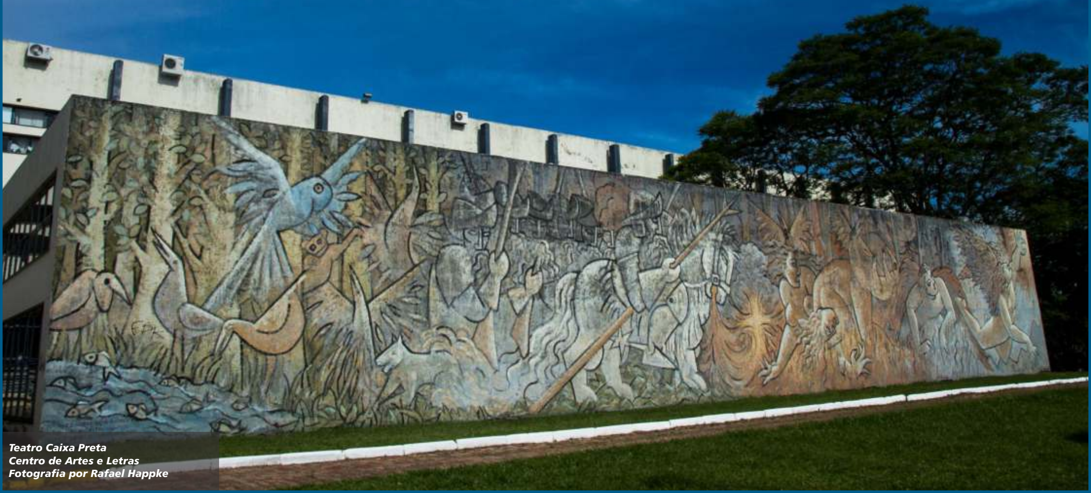
Teatro Caixa Preta Centro de Artes e Letras