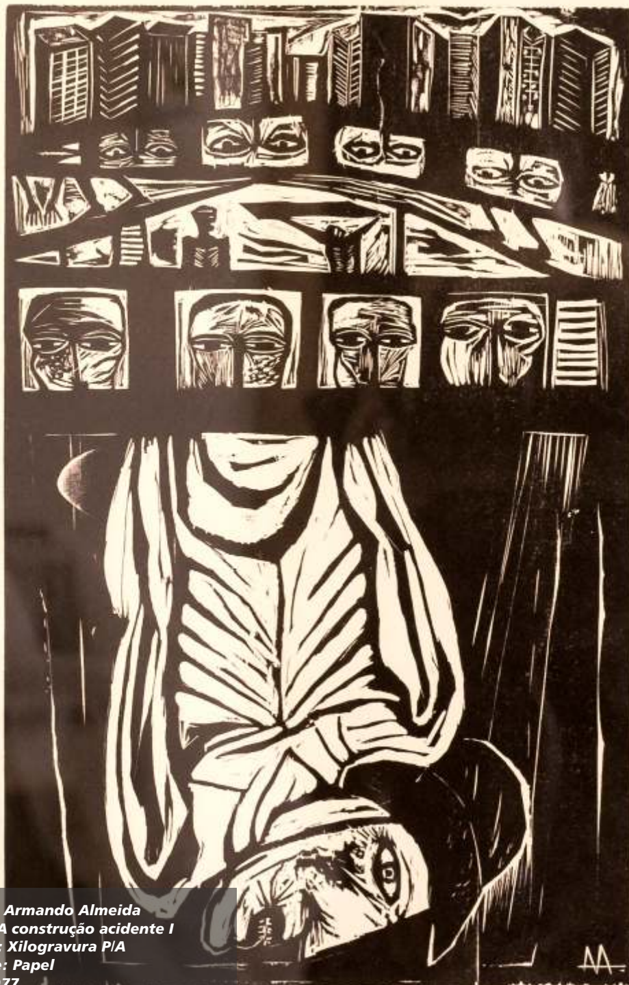
Artista: Armando Almeida Título: A construção acidente I Técnica: Xilogravura P/A Suporte: Papel Ano: 1977 Dimensões: 48,5 cm x 33,5 cm