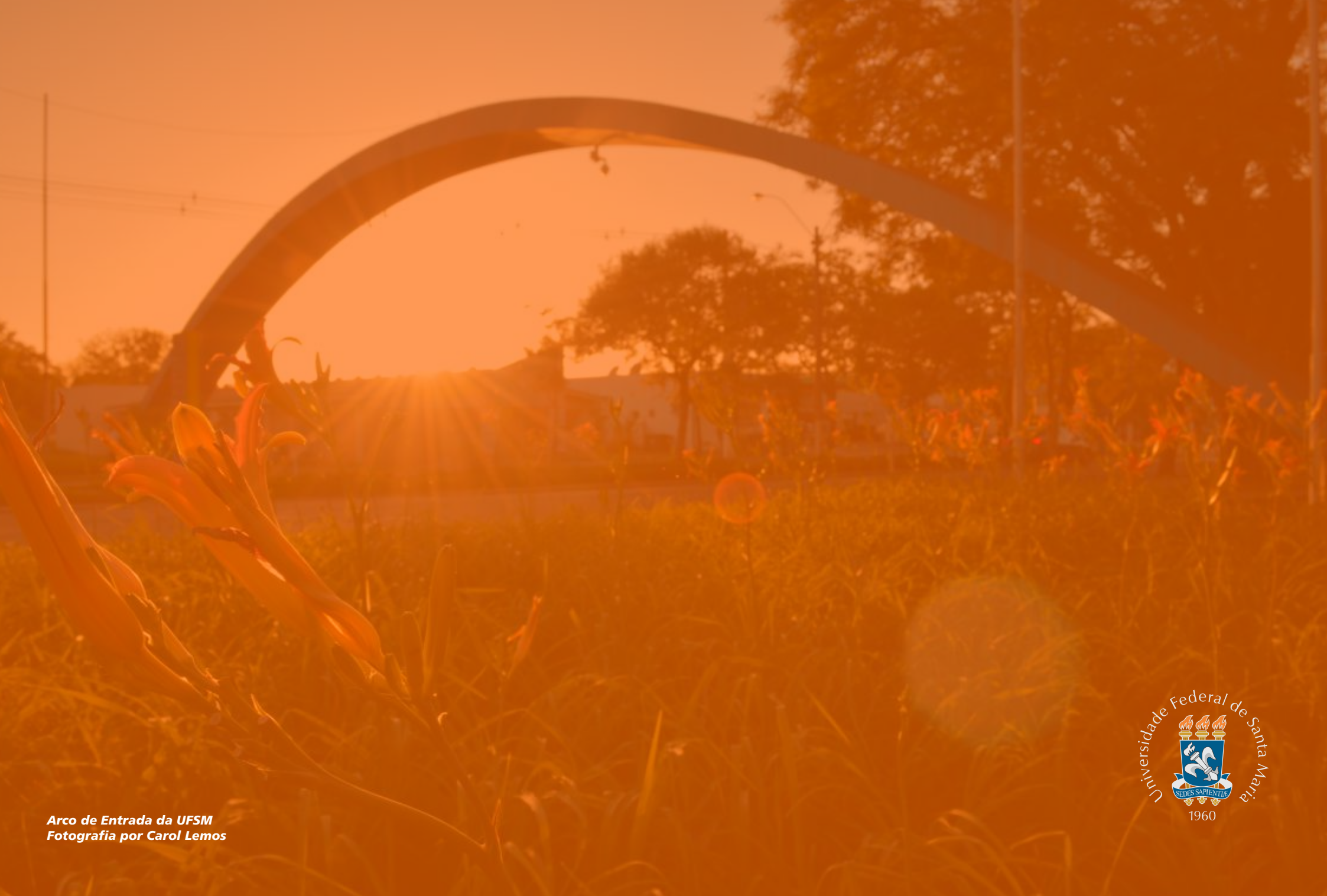
Arco de Entrada da UFSM