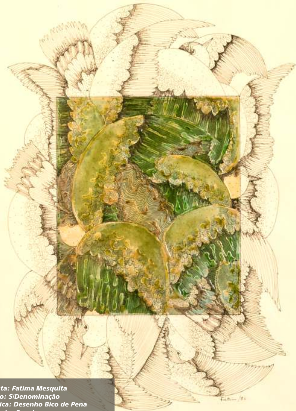
Artista: Fatima Mesquita Título: S/Denominação Técnica: Desenho Bico de Pena Suporte: Papel Ano: 1980 Dimensões: 50 cm x 63 cm