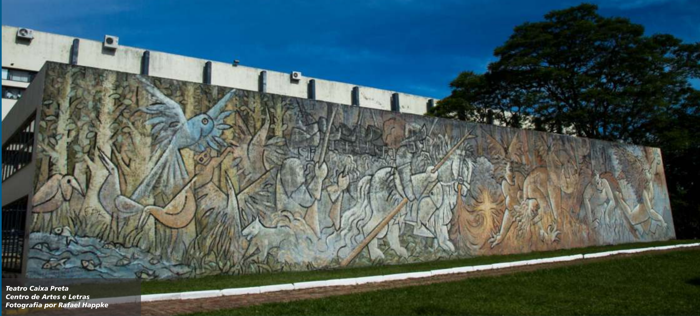
Teatro Caixa Preta Centro de Artes e Letras