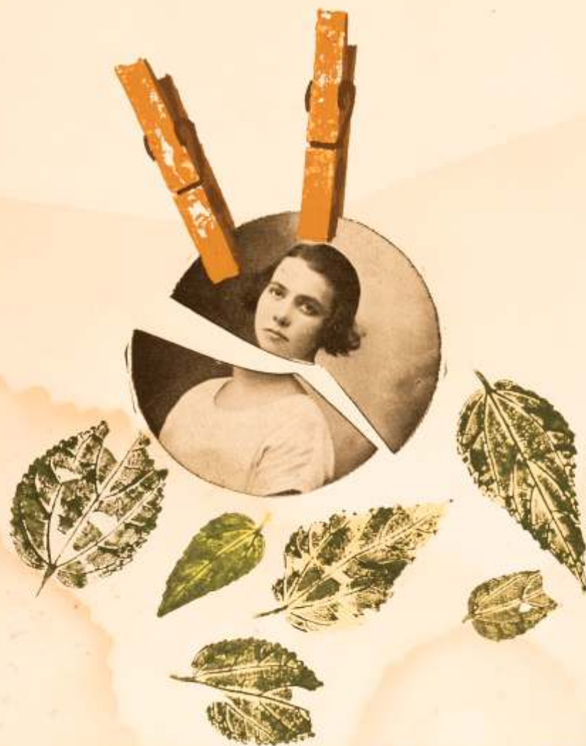
Artista: Paulo de Andrade Título: Folhas Bonecas e Reminiscências Técnica: Serigrafia Suporte: Papel Ano: 1980 Dimensões: 24 cm x 34 cm

Folhas, bonecas e reminiscências - Paulo de Andrade 1980