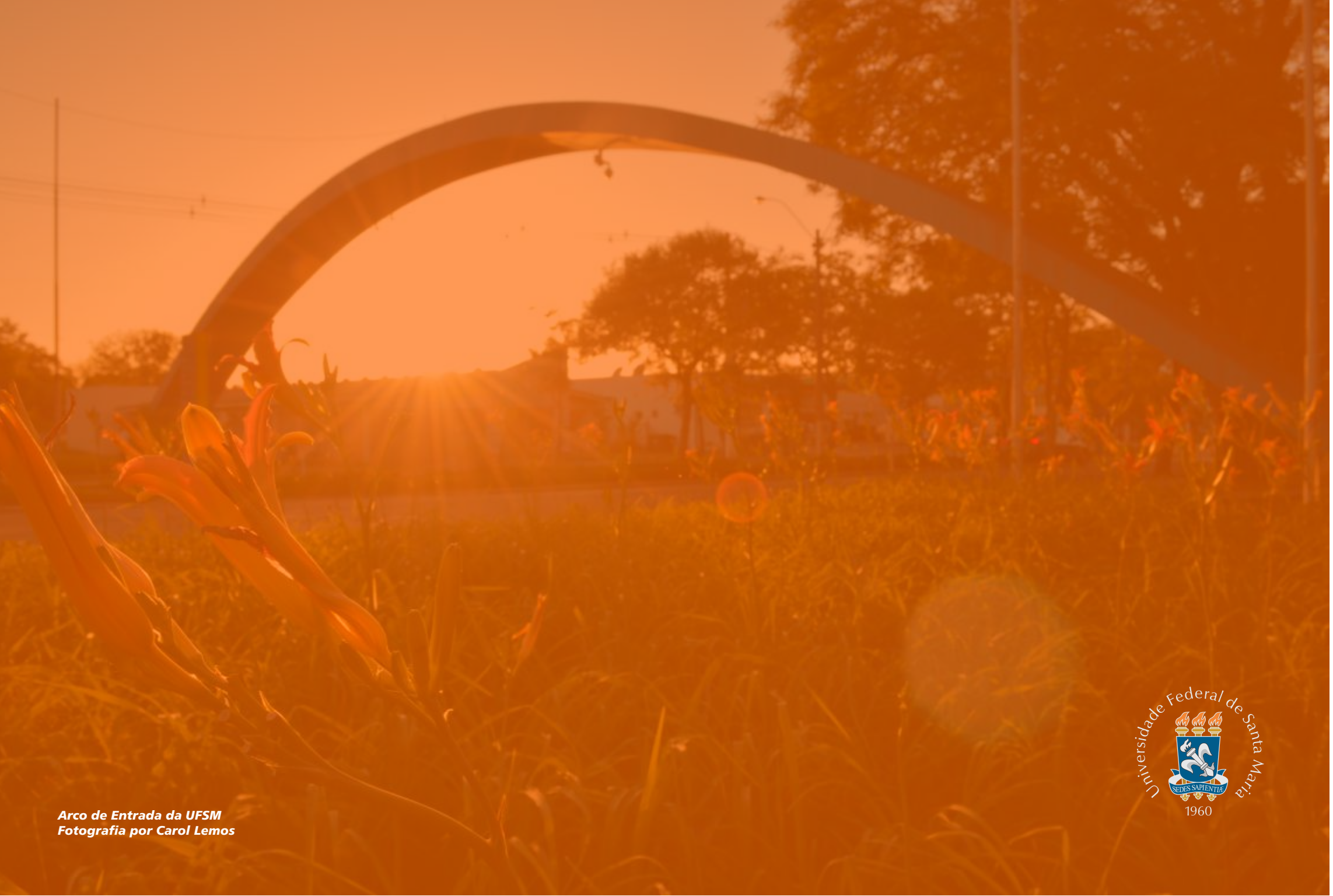
Arco de Entrada da UFSM