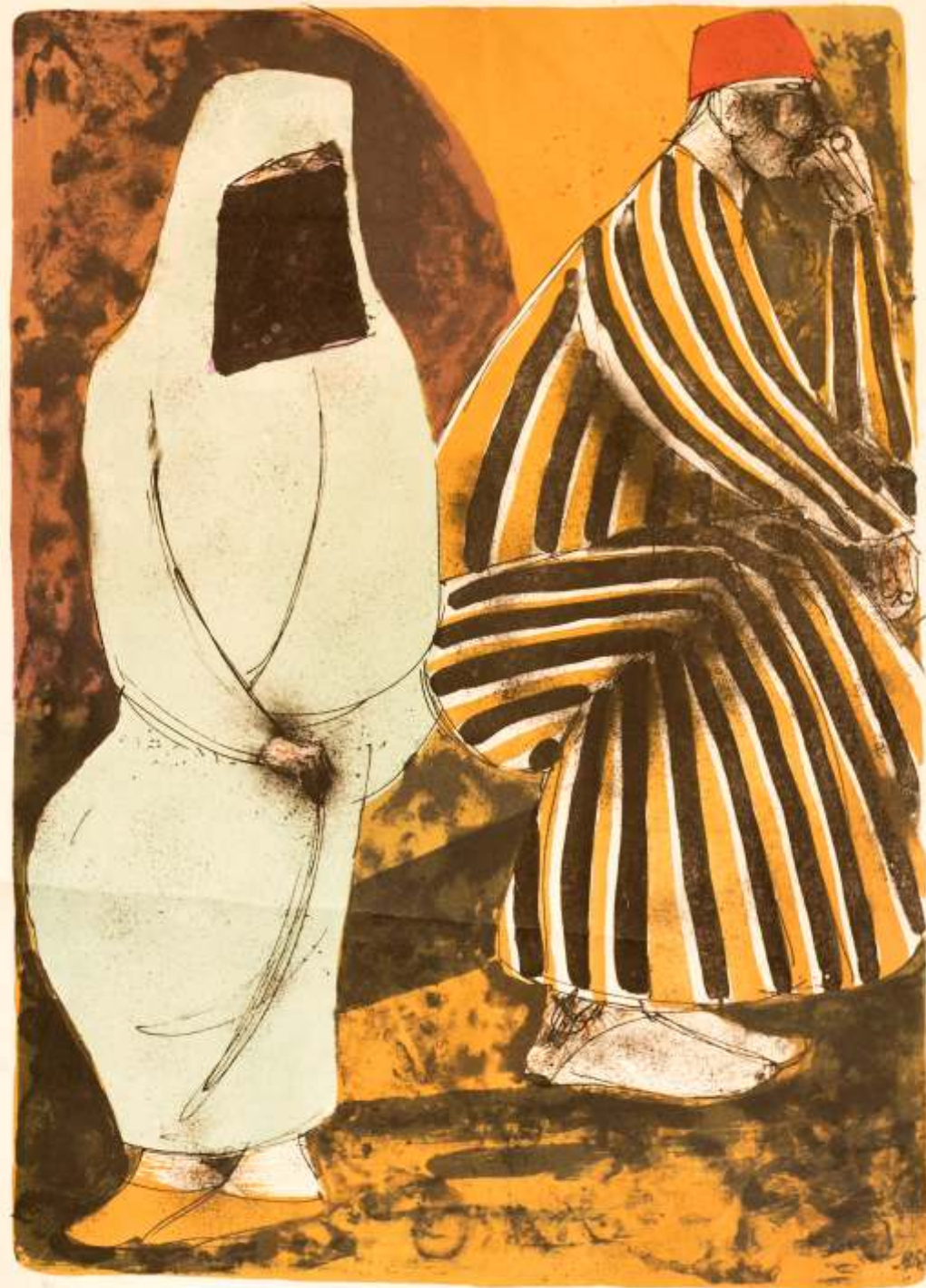
Artista: Danubio Villanil Gonçalves Título: Marrocos IV Técnica: litografia 9/20 Suporte: Papel Ano: 1980 Dimensões: 38 cm x 53 cm