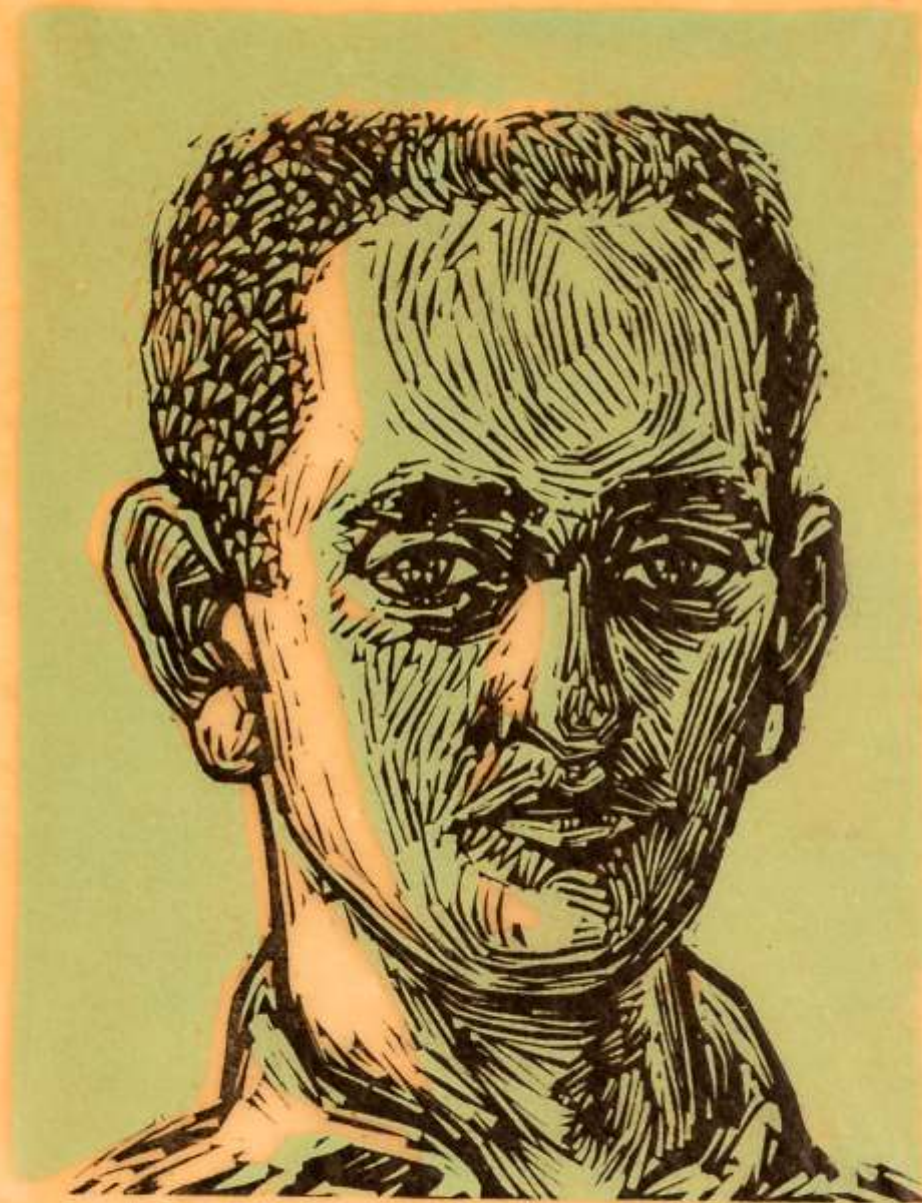
Artista: Carlos Scliar Título: Autorretrato Técnica: Linoleogravura 70/100 Suporte: Papel Ano: Não consta Dimensões: 33 cm x 47 cm