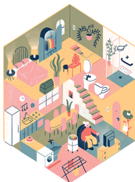
Ilustração: Henri Campeã/SAÚDE é Vital

Entretanto, a busca ativa de moradores/as regressantes poderá ser realizada com base: no relato de outros/as moradores/as e das equipes de trabalho e/ou acompanhamento do Programa de Moradia (Serviço de Vigilância, Serviço de Limpeza, Serviço de Patrimônio, Diretoria das CEUs, Ouvidoria, diferentes setores da PRAE e/ou dos campi fora de sede);