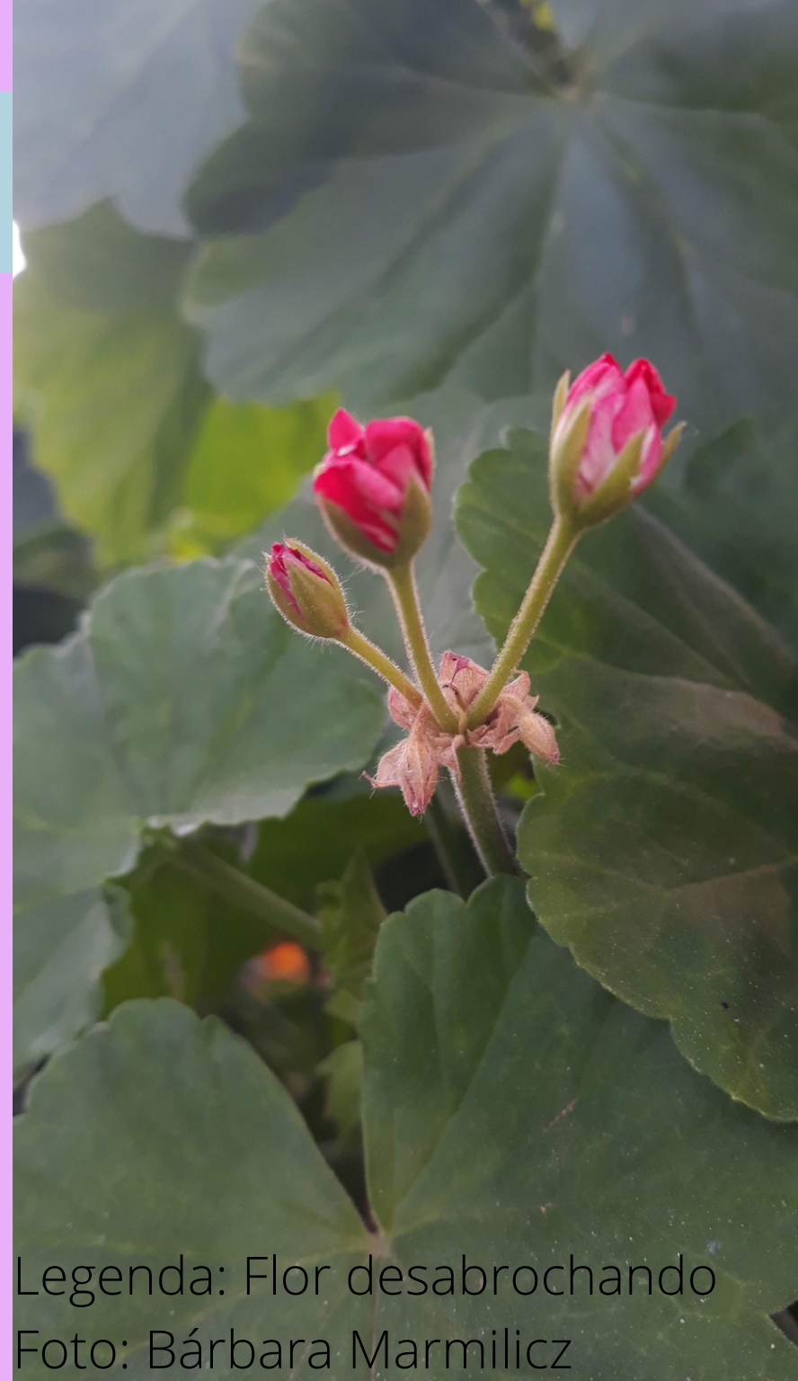
Legenda: Flor desabrochando

Agradecer: Demonstrar gratidão, oferecer graças. Compreender e agradecer pelos "pequenos" momentos vividos.