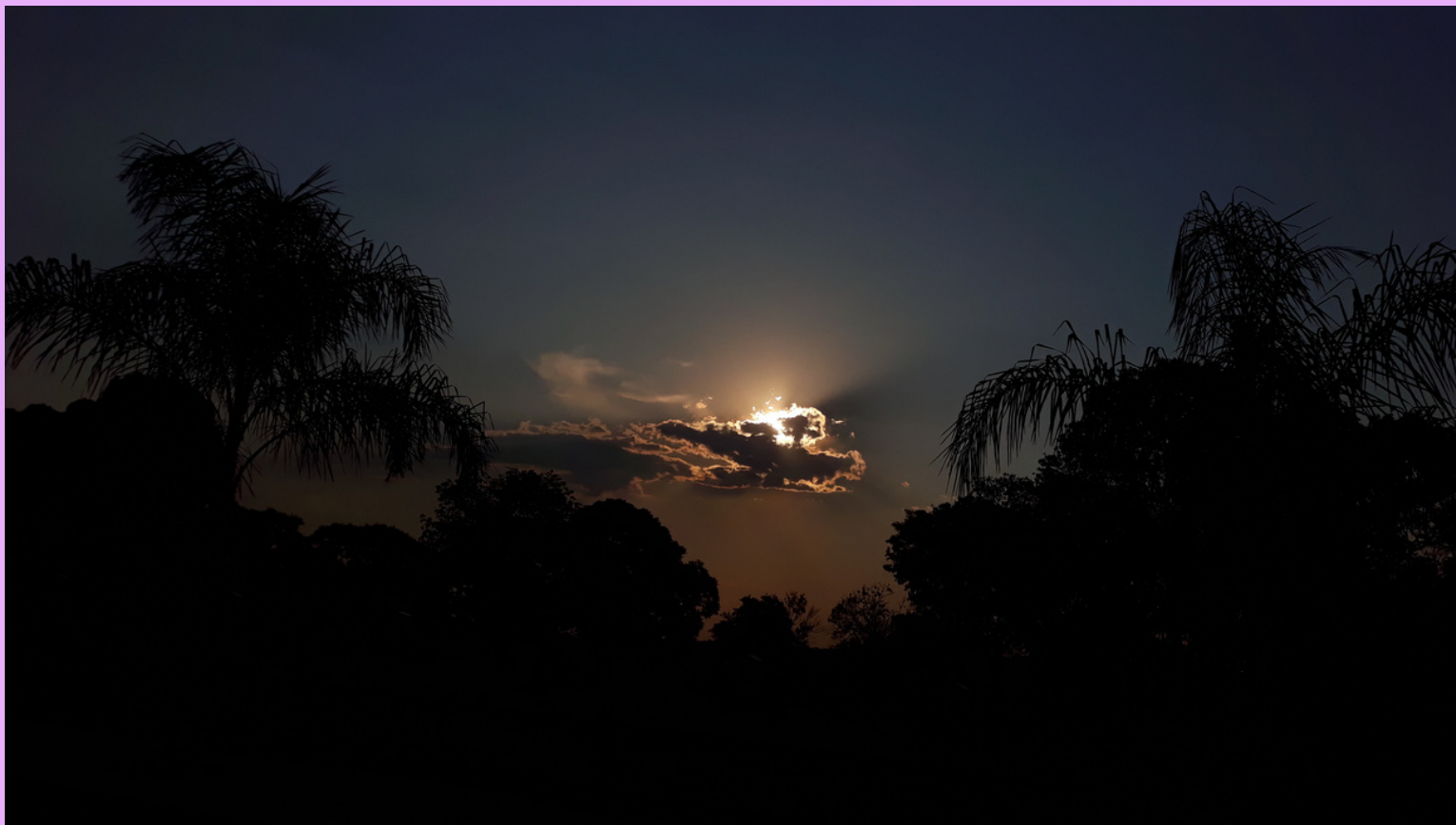
Pôr-doSol, em Guarani das Missões - RS