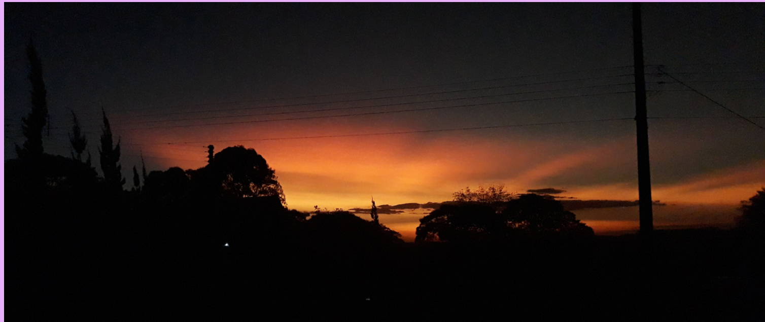
Pôr-do-Sol. Céu com cinzas do Vulcão Tonga.

Suspender uma ação, interromper, manter-se num determinado lugar.