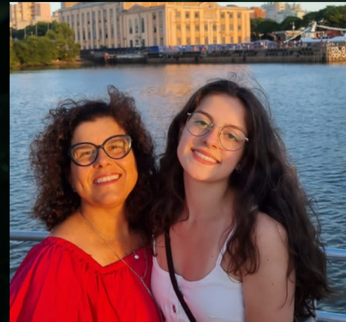
MÃE DA VALENTINA