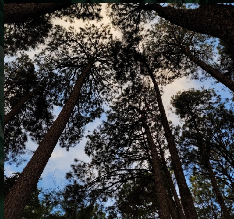
BOSQUE DA UFSM

Plano de fundo natural. Transmite sensação de mistério e encanto.