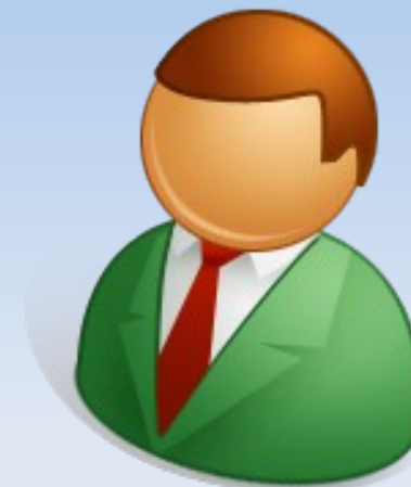
Chefe de Departamento