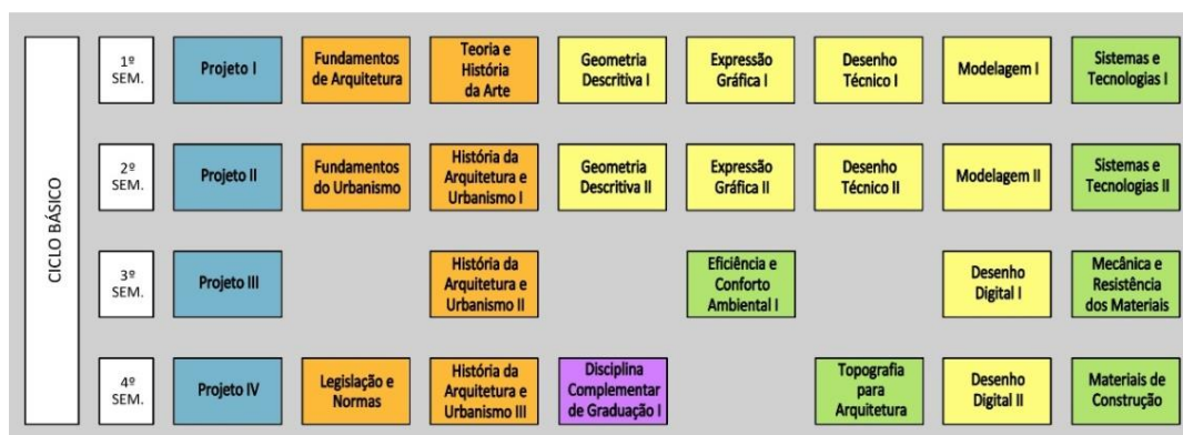
Figura 01 – Disciplinas que compõem o ciclo básico do curso de Arquitetura e Urbanismo UFSM – CS.