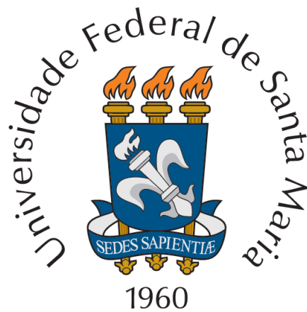
(fonte Times New Roman, tamanho 10, centralizado, espaçamento simples)