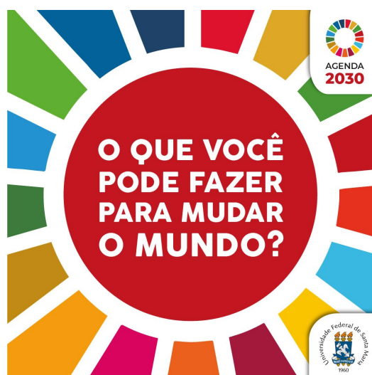
Figura 1 - Card Agenda 2030