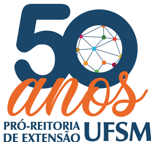
Figura 1 - Foto tal (em fonte Times New Roman tamanho 10, negrito, centralizado)

(em fonte Times New Roman tamanho 10, centralizado)