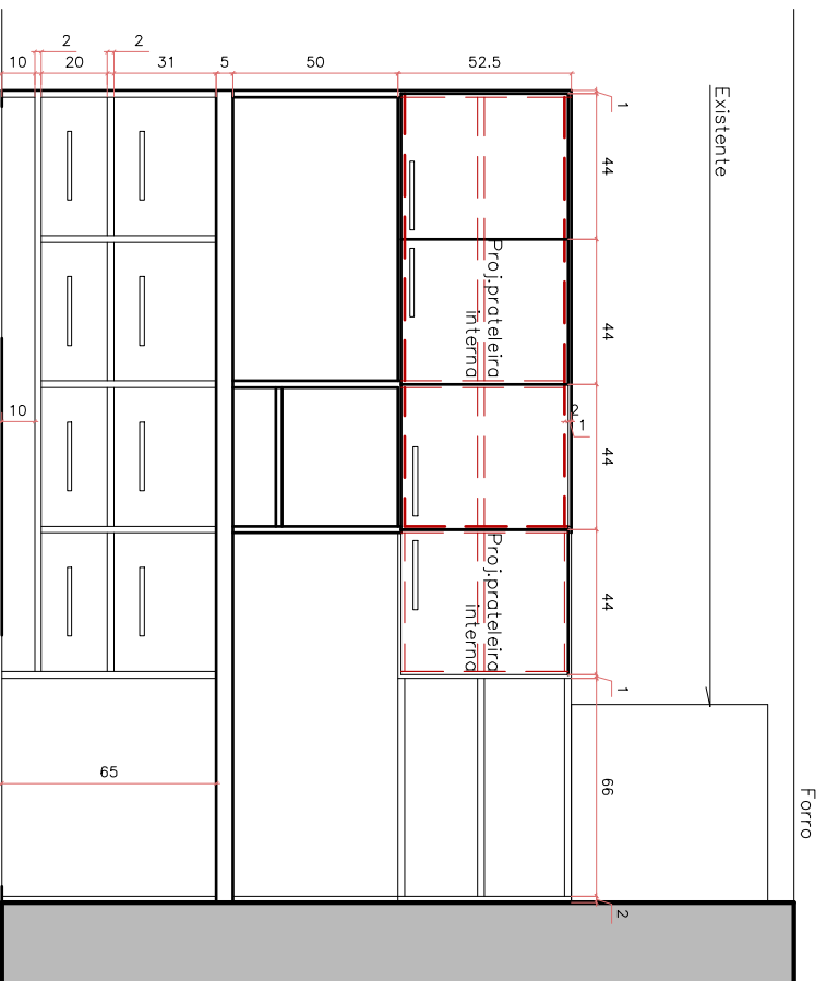
VISTA FRONTAL COTADA ESCALA 1/25