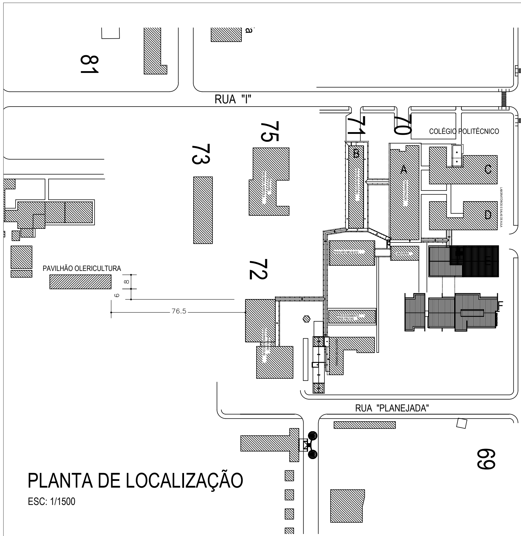
PLANTA DE LOCALIZAÇÃO ESC: 1/1500