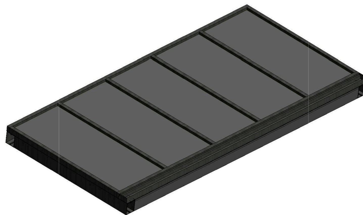
3 Perspectiva da Cobertura