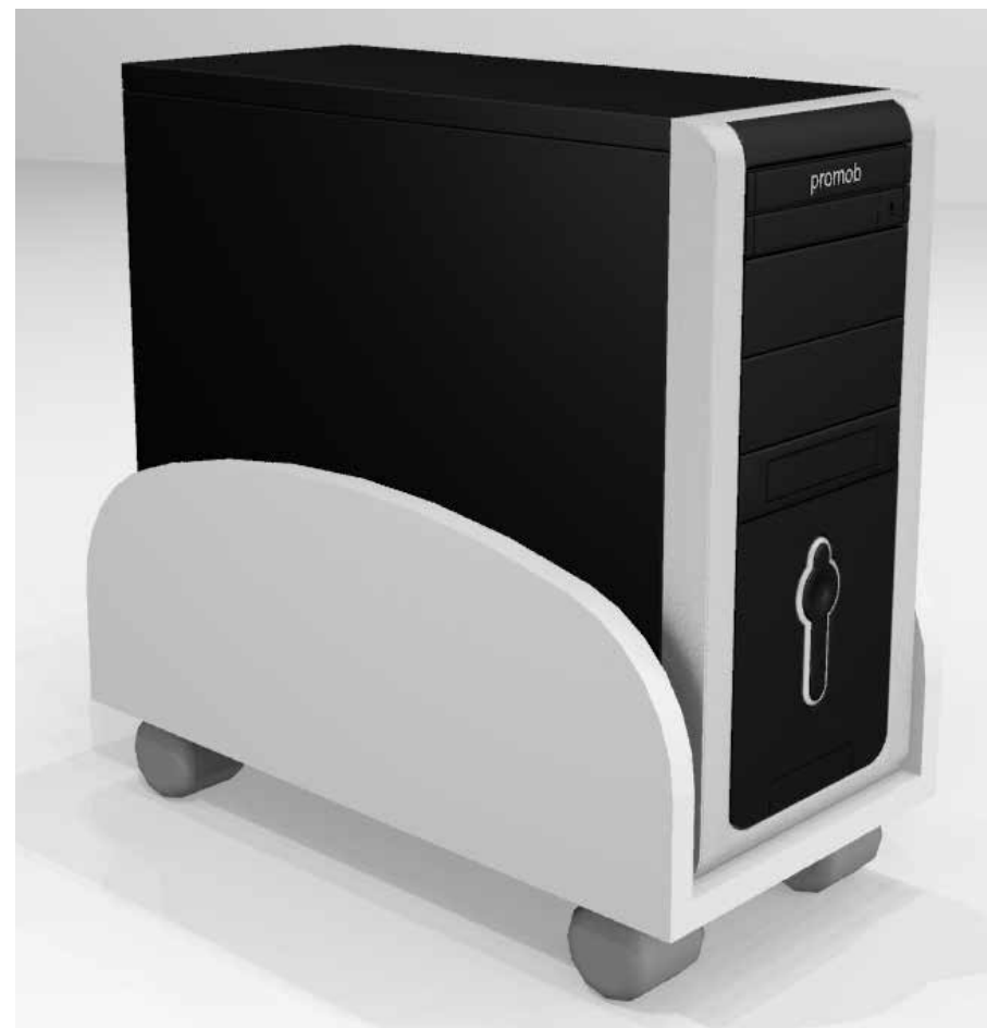
Imagens ilustrativas - Cores serão definidas posteriormente.

Suporte volante para gabinete CPU com as seguintes especificações: Bandeja em formato U confeccionado em madeira MDF de 18 mm de espessura revestida com filme melamínico texturizado BP em ambas as faces, com acabamento em fita de borda PVC de 2 mm de espessura e raio 2 mm em todas as extremidades. Possui base de apoio de 28x50 cm e laterais de fechamento de 20 cm. Rodízios de duplo giro com 50 mm de diâmetro em silicone fixados na base inferior do gaveteiro por meio de buchas de nylon 8mm e parafusos Philips 3,5 x 14 cabeça chata, fazendo com que possa montar e desmontar sem danos posteriores.