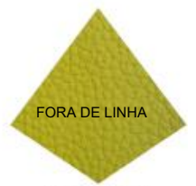
Mostarda A - 1309