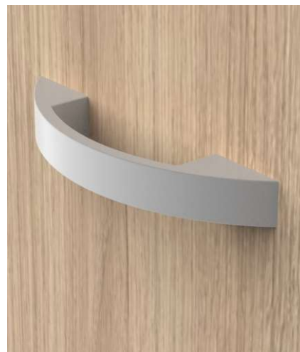
OPCIONAL PUXADOR ALÇA DE ALUMÍNIO