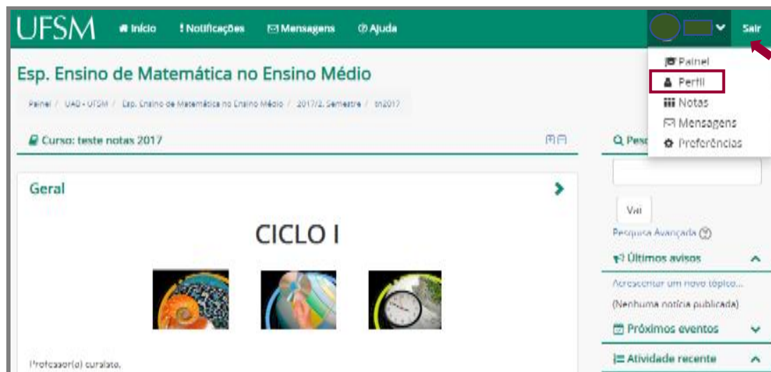
Figura 2: Página inicial de uma disciplina no Moodle UAB