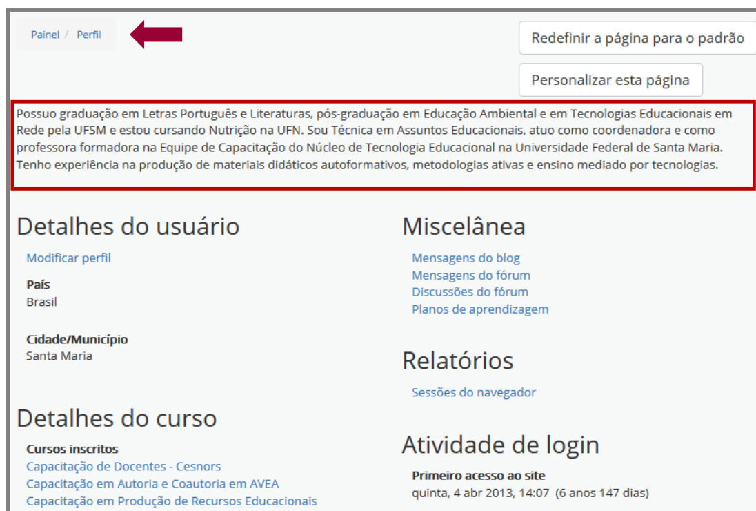
Figura 5: Página do perfil do usuário no Moodle com descrição

Quando o item “Descrição” contém um conteúdo, informado e salvo pelo usuário, esse conteúdo aparece na tela do “Perfil” do usuário (Figura 5).