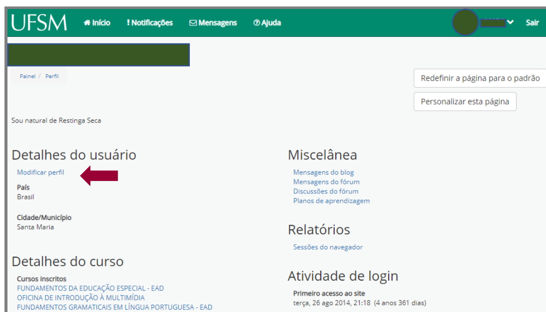
Figura 3: Tela do perfil do usuário no Moodle

Ao selecionar a opção “Perfil” uma tela, na qual constam informações sobre “ Detalhes do usuário ”, “ Detalhes do curso ”, “ Miscelânea ”, “ Relatórios ” e “ Atividade de login ” é exibida (Figura 3).