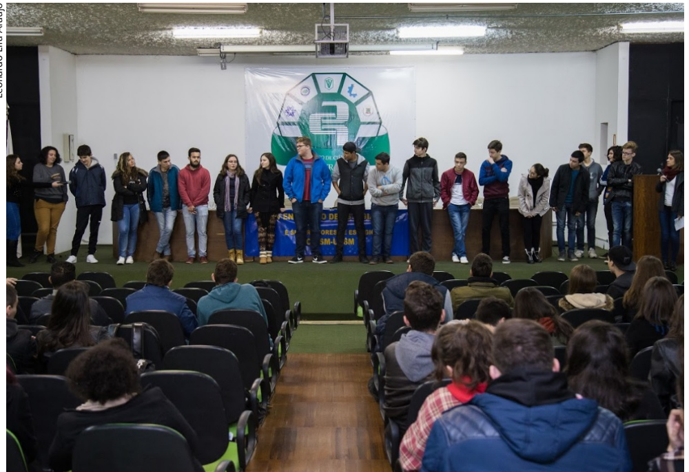
Alunos e estagiários do CTISM relatam experiências de estágio no auditório do CCR, nesta sexta (9).