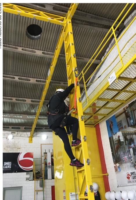
Aluna de Segurança treina trabalho em altura.