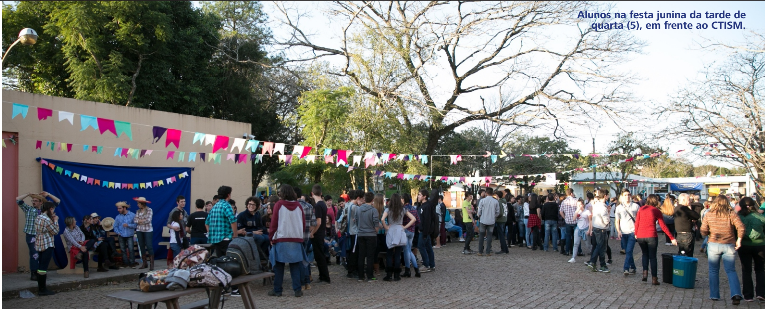
Alunos na festa junina da tarde de quarta (5), em frente ao CTISM.