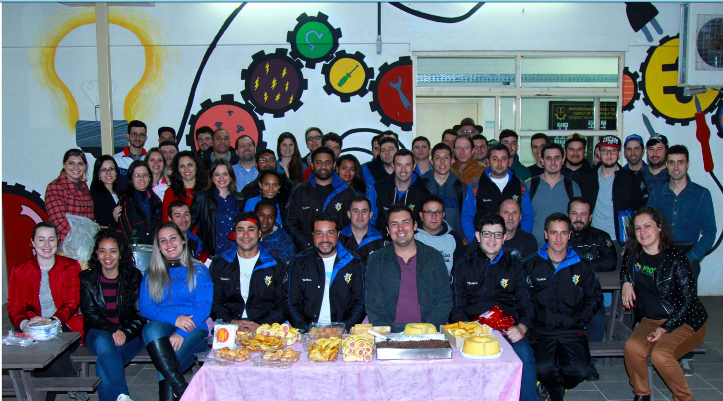
Alunos, ex-alunos e professores do curso de Eletromecânica Proeja e servidores do CTISM posam para foto em celebração de dez anos da modalidade.