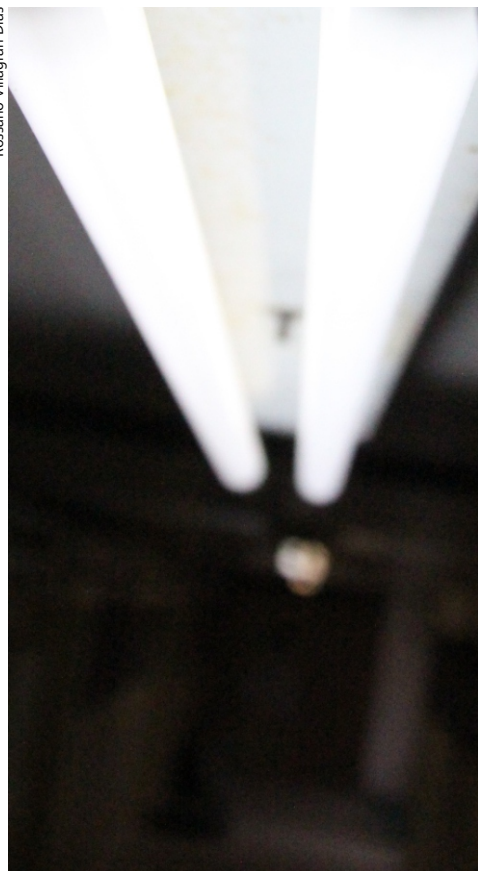
Lâmpadas fluorescentes em corredor do CTISM.

No entanto, não é possível saber quanto o CTISM vai economizar na conta de luz. Leia mais no site do CTISM.