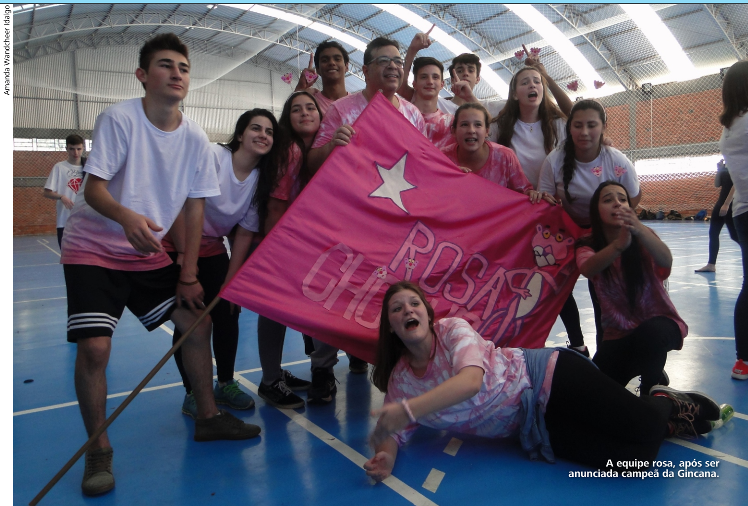
A equipe rosa, após ser anunciada campeã da Gincana.

À reportagem, a Direção expressou parabenização “a toda a comunidade do CTISM” pelo envolvimento na atividade. Leia mais e veja outras imagens no site do CTISM.