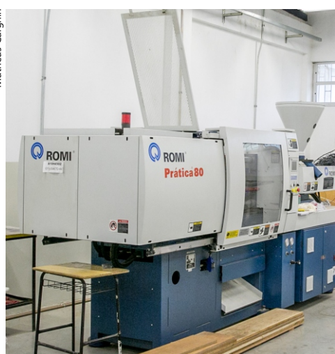
Centro de usinagem CNC, usado em Mecânica.

Na próxima terça (10), será a vez de a turma 423 lançar seu jornal A Nuvem no auditório do Estúdio SAB, a partir das 9h30min.