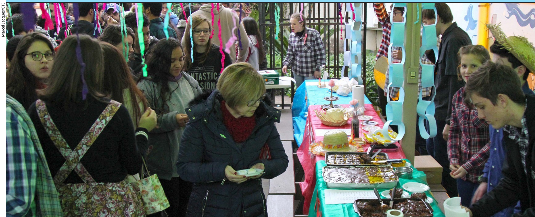
#AcendeAFogueira Cena da festa junina do CTISM, promovida no fim da tarde do dia 4 no pátio interno. No Arraiá do CTISM, as turmas de terceiro ano dos cursos integrados venderam chocolate quente e outras bebidas e comidas como pipoca, pizza, bolos, hot dog , rapadura, carrapinha e cocada. O evento contou com DJ e brincadeiras de cadeia e cama elástica. Veja mais fotos no site do CTISM.