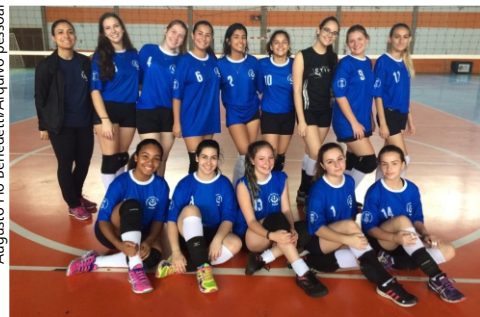
Alunas da equipe de vôlei feminino do CTISM.

A equipe do CTISM venceu a etapa municipal do torneio de vôlei feminino juvenil dos Jergs (Jogos Escolares do Rio Grande do Sul), e vai representar Santa Maria na competição regional. O time, formado por alunas dos cursos integrados, superou outras cinco equipes de escolas santa-marienses. As disputas municipais ocorreram na quarta-feira (10) no Centro Desportivo Municipal. A fase regional será em setembro.