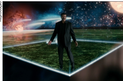
Cientista Neil deGrasse Tyson em cena da série.