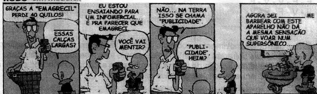
ROBÔ - Jim Meddick

A sequência que completa corretamente as lacunas no primeiro e no último quadrinho é, respectivamente,