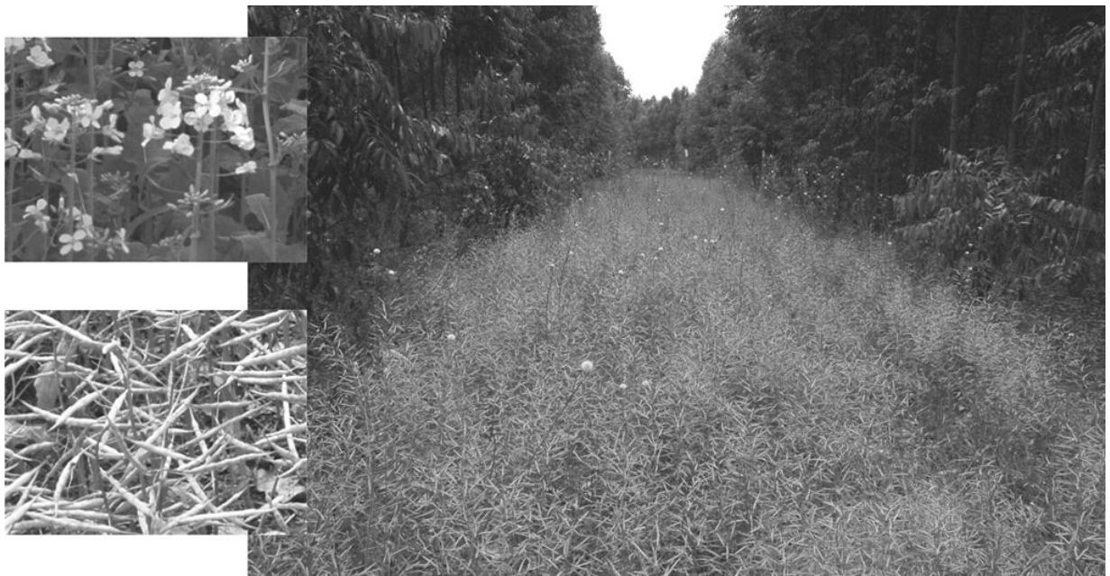
Figura 1: Aspecto da flor, vagem e do plantio de canola no sistema agroflorestal com eucalipto.

Os dados aqui apresentados são de uma área experimental localizada no município de Candiota, RS, região também conhecida como Pampa Gaúcho. Nesta área, pertencente à Empresa Fibria Celulose S.A., foi semeada em maio de 2008, a variedade de canola Hyola 61, híbrido com resistência poligênica à canela preta (principal doença da canola), e com boa adaptabilidade em regiões com deficiência hídrica e frios intensos. A semeadura da canola foi realizada manualmente em um sistema agroflorestal com eucalipto ( Eucalyptus urograndis ) com 2,5 anos de idade num espaçamento que abrange linhas duplas (3 m x 2 m) e 10 m entre as linhas duplas, espaço este utilizado para o cultivo da canola (Fig. 1).