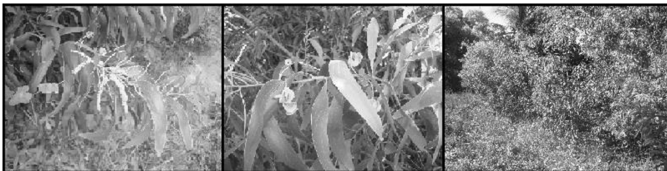
FIGURA 1: Espécie A. mangium , em parcela amostral na área do Tamandaré.

Ilhas Molucas é muito utilizada na América do Sul principalmente com fins comerciais como para a produção de polpa de tanino e para lenha, e também para a recuperação de áreas degradadas e em arborização urbana (FIGURA 1).