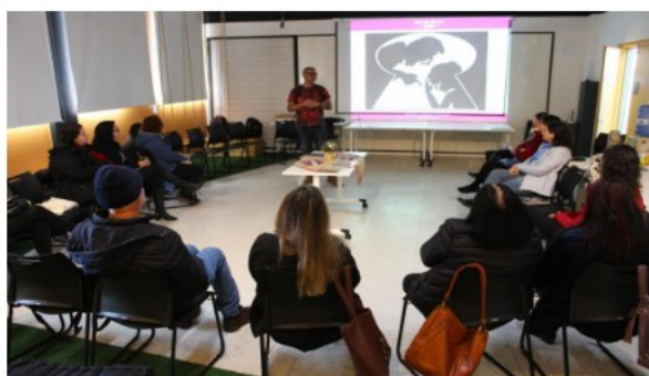
Oficina do projeto Nem tão Doce Lar