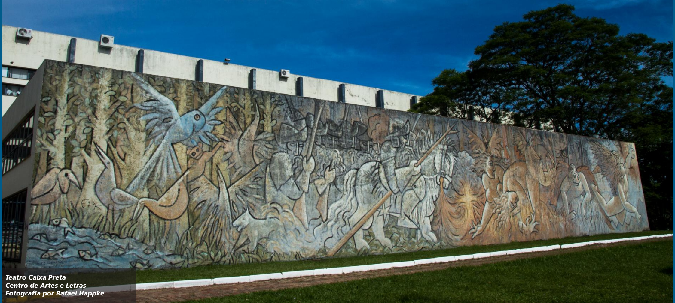
Teatro Caixa Preta Centro de Artes e Letras