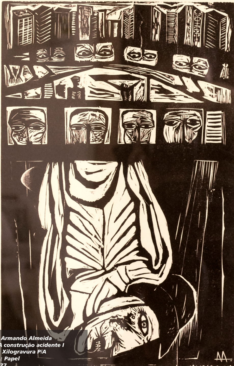
Artista: Armando Almeida Título: A construção acidente I Técnica: Xilogravura P/A Suporte: Papel Ano: 1977 Dimensões: 48,5 cm x 33,5 cm