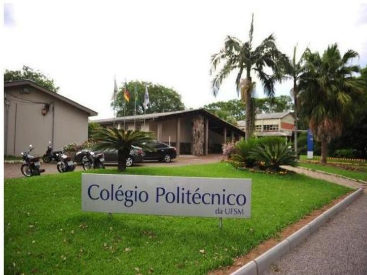
Colégio de Santa Maria costuma estar entre os melhores estabelecimentos gaúchos no Enem

O Rio Grande do Sul tem apenas um estabelecimento no ranking dos cem melhores colégios do país, segundo a média das provas objetivas do Exame