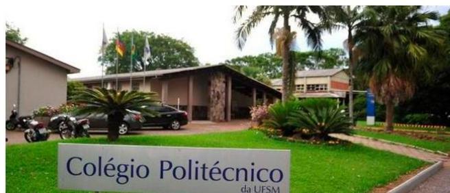
Politécnico da UFSM lidera ranking do Enem no RS

Compartilhar: F Curtir Compartilhar 24 Tweeter 0 Mais opções