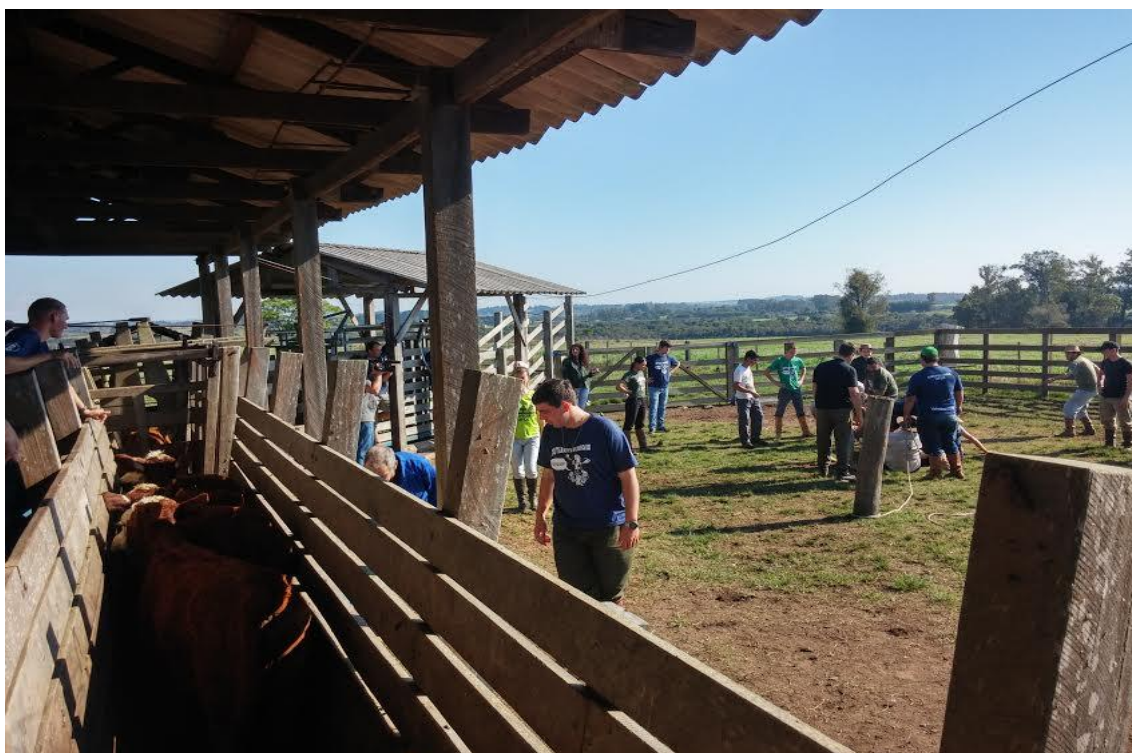
Animais no brete sendo vacinados