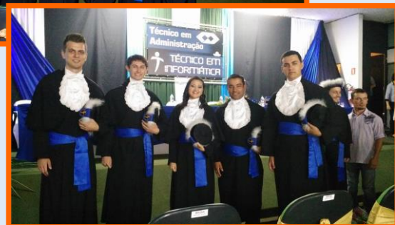
Turmas do Téc. em Administração e Téc. em Informática