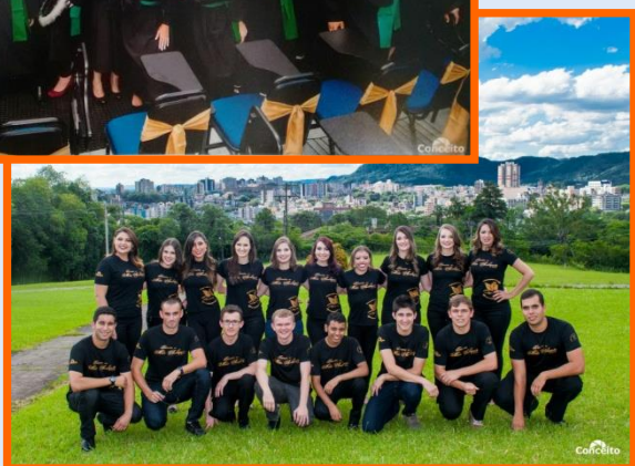
Turma do Téc. em Meio Ambiente