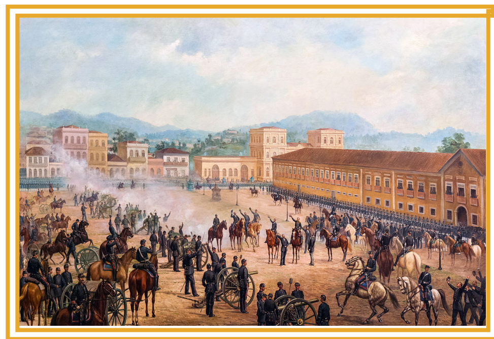
"Proclamação da República", 1893, óleo sobre tela de Benedito Calixto (1853-1927).

A data é considerada feriado nacional de acordo com a legislação brasileira, sendo que a primeira lei que reconheceu o dia é de 14 de janeiro de 1890, pelo Decreto nº 155-B, que a determinou como um momento para celebrar a “pátria brasileira”. Outras leis vieram em seguida para reforçar a Proclamação da República como feriado, tanto na Era Vargas quanto na Quarta República. A ação legislativa mais recente que abrange a data por força de lei é de 19 de dezembro de 2002, durante o governo de Fernando Henrique Cardoso. A Lei em questão é de nº 10.607, que cita todos os feriados nacionais do Brasil, sendo o 15 de novembro um deles.