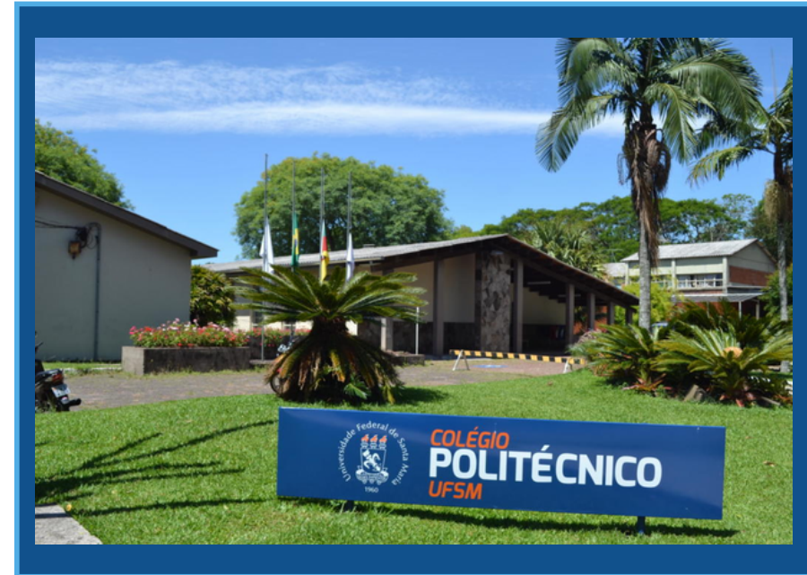
Vista do Colégio Politécnico da UFSM

Este guia irá auxiliar você nesse processo inicial, facilitando sua experiência enquanto estudante nesta instituição!