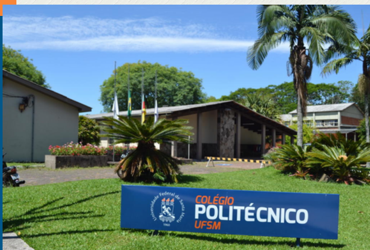
Vista do Colégio Politécnico da UFSM (Bloco A)

Este guia irá lhe auxiliar nesse processo inicial, facilitando sua experiência enquanto estudante nesta instituição!