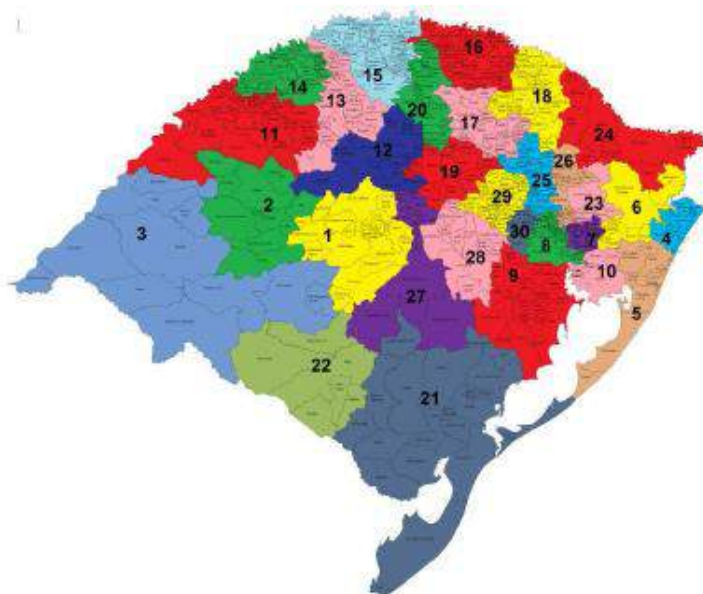
Figura 2: Regiões de Saúde do RS