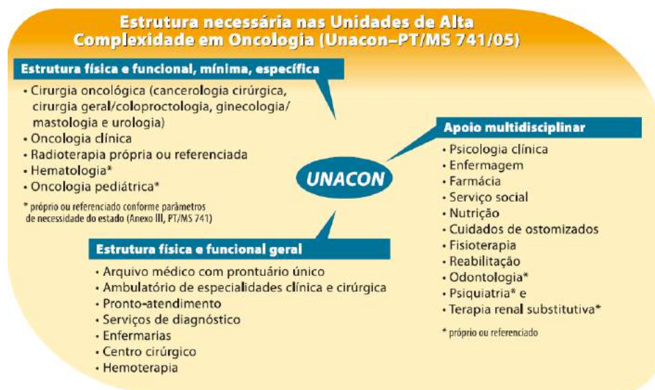
Figura 1: Caracterização de uma UNACON