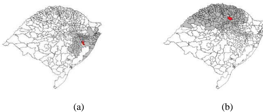
Figura 5: Cidades referenciadas a UNACONs selecionadas

Para o desenvolvimento do problema de transporte houve a necessidade de padronização da distância percorrida pelo paciente nos casos em que o município é ofertante e referência, tendo sido adotado um valor de 7 km, devido ao deslocamento ser dentro do perímetro urbano do município. Também foi determinado que a distância percorrida entre municípios muito distantes dos centros de UNACON seria considerada como 1000 km, forçando a sua exclusão do ajuste ótimo na solução com auxílio do software. De modo a permitir que o modelo considerasse ajustes distintos daquele atualmente adotado, foram estudadas as distâncias de municípios que potencialmente poderiam ser atendidos pelas UNACONs em função de sua proximidade. A Figura 5 exemplifica este procedimento em relação às UNACONs localizadas nas cidades de Porto Alegre (a) e Passo Fundo (b), em vermelho, produzido com o auxílio do software Tabwin.