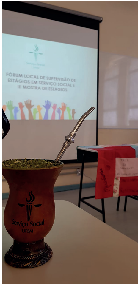
FIGURA 04 – III Fórum Local de Supervisão de Estágios Serviço Social UFSM (2019)