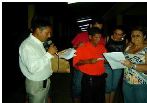
Figura 1: Aluna Repórter da escola entrevistando a coordenadora da 8ª CRE, 2012.