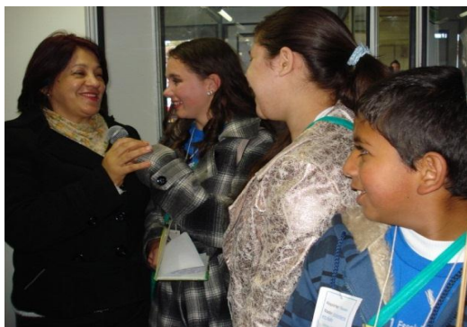
Figura 2: Alunos da EJA-apresentando trabalhos, 2003.

Constatou-se a criatividade, o interesse e a motivação dos educandos ao realizarem pesquisas, produzir trabalhos e gravar no Software Audacity. No rendimento escolar notou-se um grande avanço. Também se pode perceber um envolvimento maior e um melhoramento na comunicação entre os colegas, professores e comunidade. No início, tanto os educandos quanto os educadores encontraram dificuldades na realização dos trabalhos, mas aos poucos foram interagindo e “pegando” gosto pelas atividades desenvolvidas.