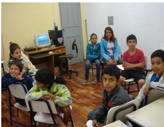
Figura 5: Alunos da escola fazendo suas gravações no Audacity, 2013.