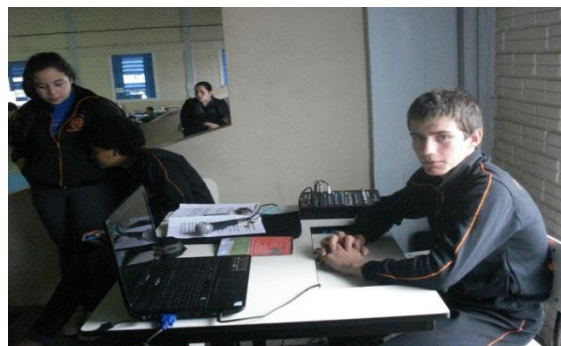
Figura 4: Alunos da escola com a rádio na Feira colonial, 2012.