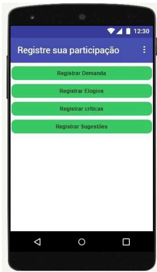
Figura 4 – Tela de registro das participações