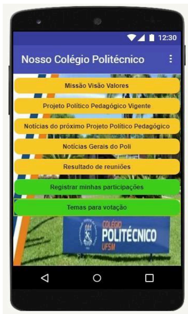
Figura 2 – Tela de informações