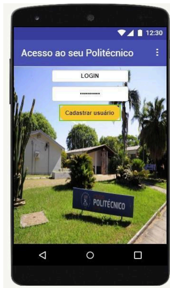
Figura 1 – Tela de login