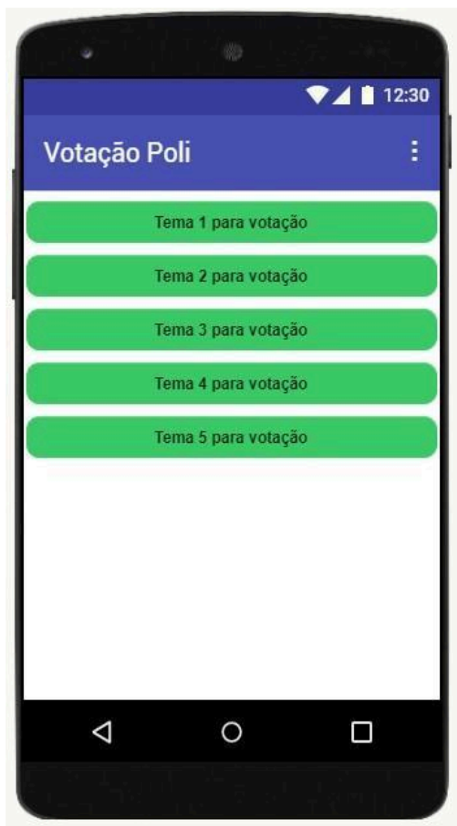
Figura 7 – Tela de temas de participação