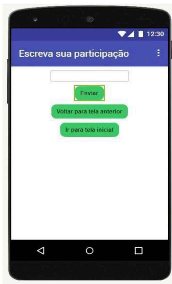
Figura 5 – Tela de envio das participações