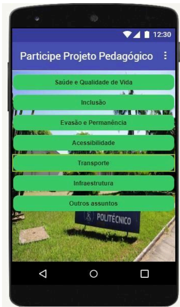
Figura 3 – Tela de participação ao Projeto Político Pedagógico