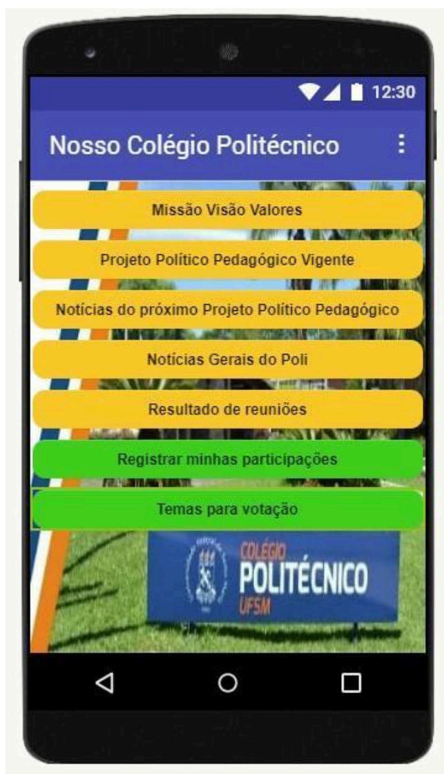
Figura 6 – Tela de participação e votação