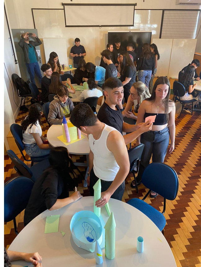
Escola Municipal Naura 1º, 2º e 3ºano = 47 alunos 14 de Nov 2024