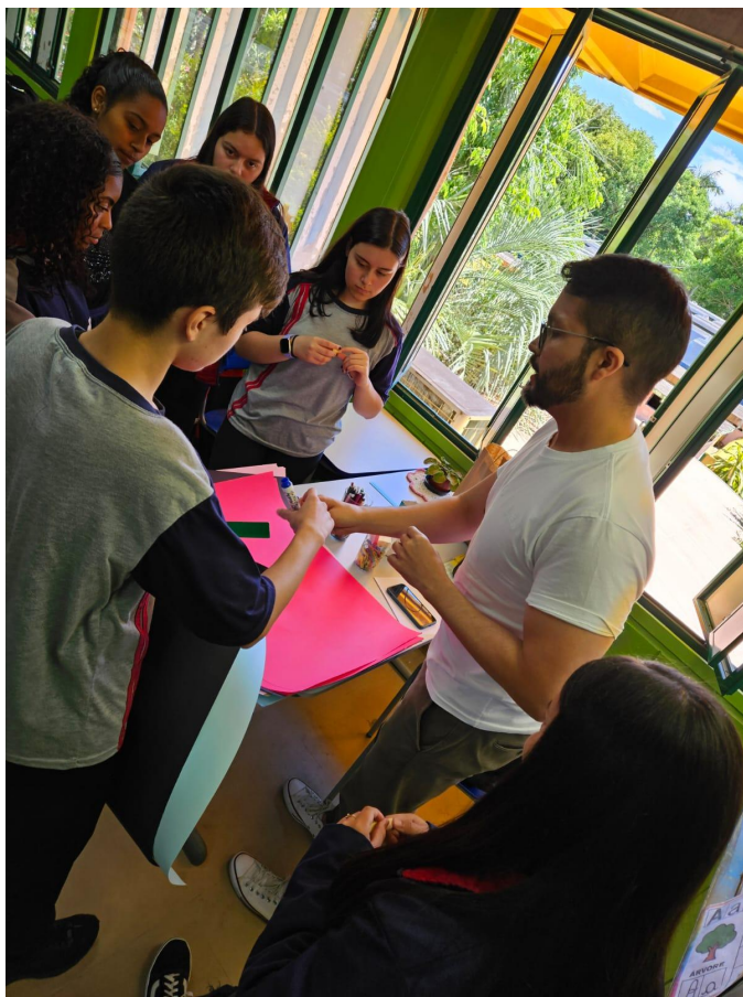
Escolha de materiais