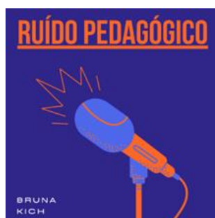
Figura 1 – Capa do podcast

Como resultado técnico desta pesquisa acerca dos professores de inglês na Educação Infantil, foi criado um Podcast, intitulado Ruído Pedagógico. Entende-se o podcast como parte das Novas Tecnologias de Informação e Comunicação (TIC's) , compreendendo “conteúdos de áudio que podem ser acessados em qualquer hora e lugar, permitido serem armazenados em ficheiros capazes de reproduzir os arquivos” (BODART & SILVA, 2001, p.3). A Figura 1 (a seguir) ilustra a capa criada para a divulgação do Podcast.