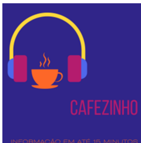
Figura 2 – Capa do Quadro Cafezinho - 15 minutos de informação.

O primeiro, intitulado Cafézinho - informação em até 15 minutos , traz um breve apanhado das Teorias da Aprendizagem e da Psicologia da Educação que embasam importantes fundamentações teóricas na Educação Infantil. Intenta-se aqui, não trazer toda a informação necessária para o/a profissional, mas apontar um caminho para que cada sujeito desenvolva sua prática de forma mais consciente, buscando mais informações caso o que lhe for apresentado desperte curiosidade ou o coloque em movimento. A duração de cada episódio do quadro Cafezinho é de até 15 minutos, fazendo menção ao café preparado na sala dos professores durante o recreio da escola. Assim, a intenção desse quadro, cuja arte está representada na Figura 2, a seguir, é apresentar de forma sintética teorias, conceitos, autores e pensadores que podem contribuir para a formação pessoal.