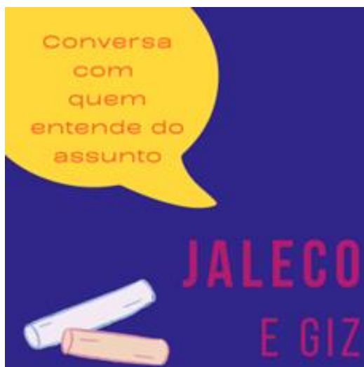
Figura 3 – Representação do Quadro Jaleco e Giz - Conversa com quem entende do assunto.

informação e conhecimento. A Figura 3, a seguir, representa a arte desenvolvida para ilustrar o quadro: