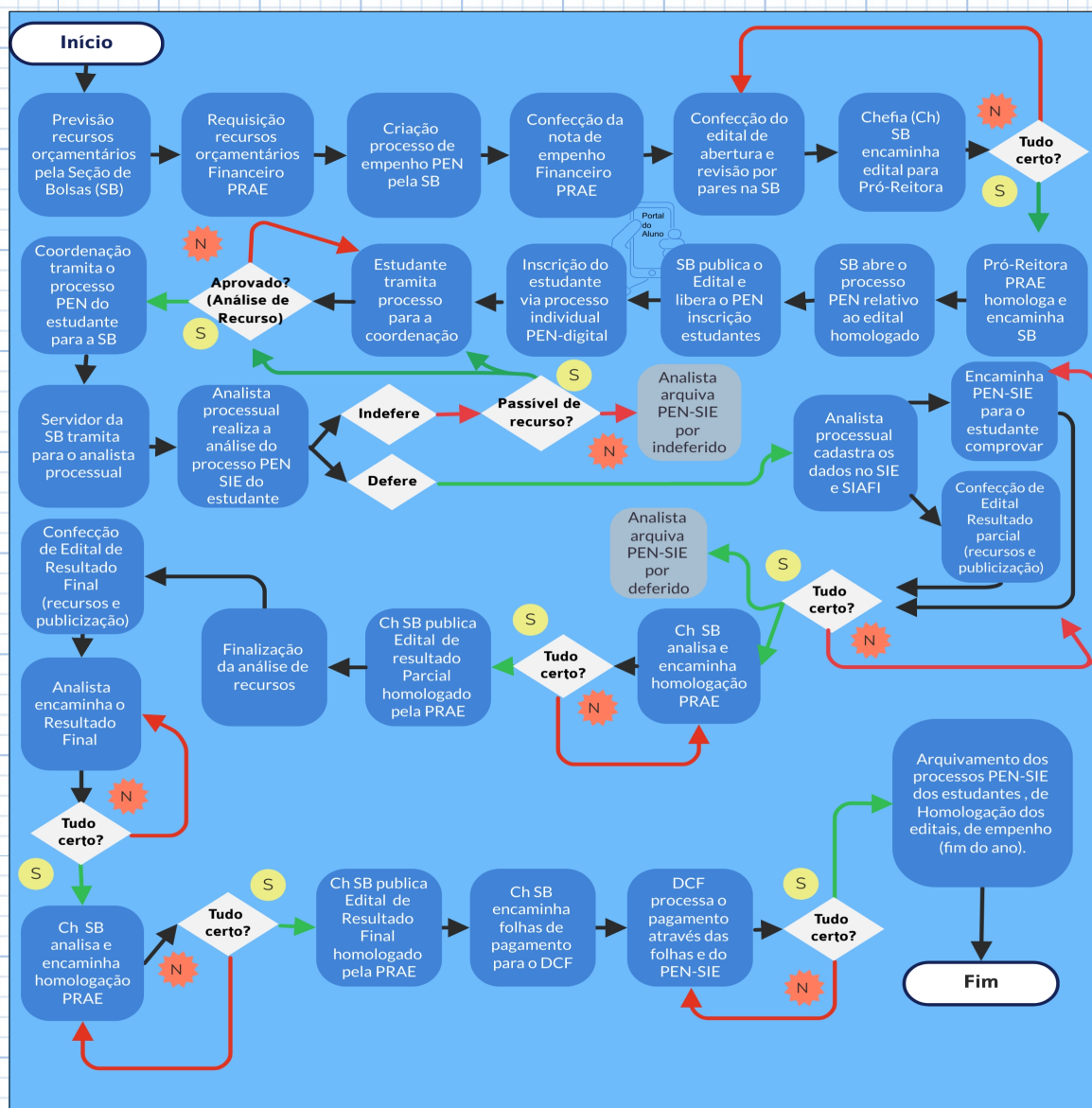
Figura 1 – Fluxo de Trabalho do Auxílio à Aquisição de Material Pedagógico