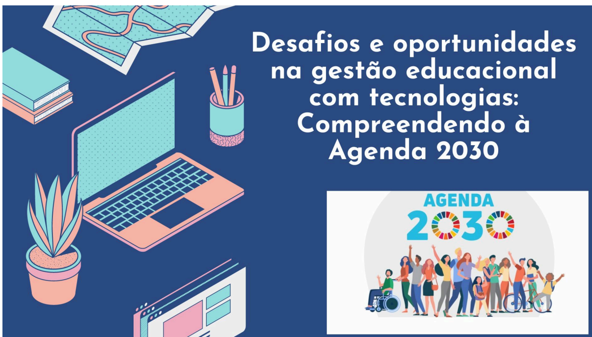
Figura 7 - Layout do Curso

Nesta etapa será detalhada a metodologia, os conteúdos a serem trabalhados, as atividades a serem desenvolvidas, a avaliação da aprendizagem, conforme o modelo ADDIE, será apresentado o mapa de atividades, que trata do planejamento do curso. Na Figura 7, observa-se o layout do curso.