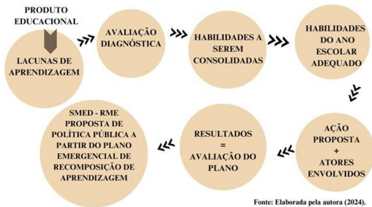
Figura 2 – Etapas do Produto Educacional

Retomar os conteúdos é um processo fundamental para promover um aprendizado mais duradouro, através de debates ou discussões que incentivem os alunos a compartilhar o que aprenderam.