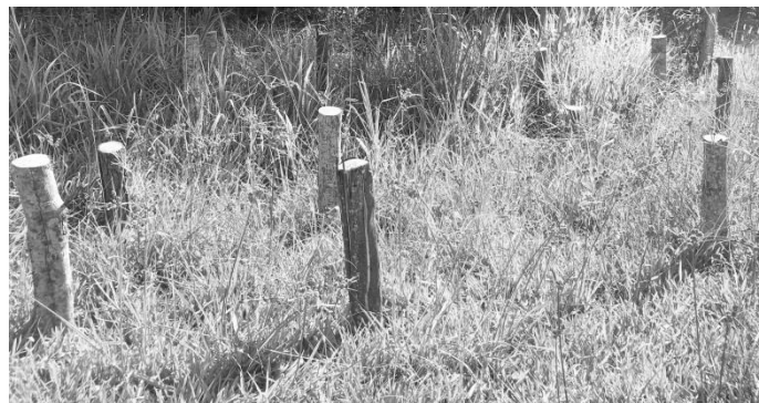
Figura 1- Campo de apodrecimento após a instalação dos moirões.

O experimento foi implantado no município de Frederico Westphalen- RS. Foram utilizadas 20 árvores, cinco para cada espécie, das quais foram confeccionados moirões roliços, com casca, retirados da parte superior das amostras, com dimensões de 1,30 m de comprimento e em média 12 cm de diâmetro. As peças foram levadas a campo, em área coberta predominantemente por gramíneas e enterradas verticalmente no solo a uma profundidade de 40 cm (Figura 1).