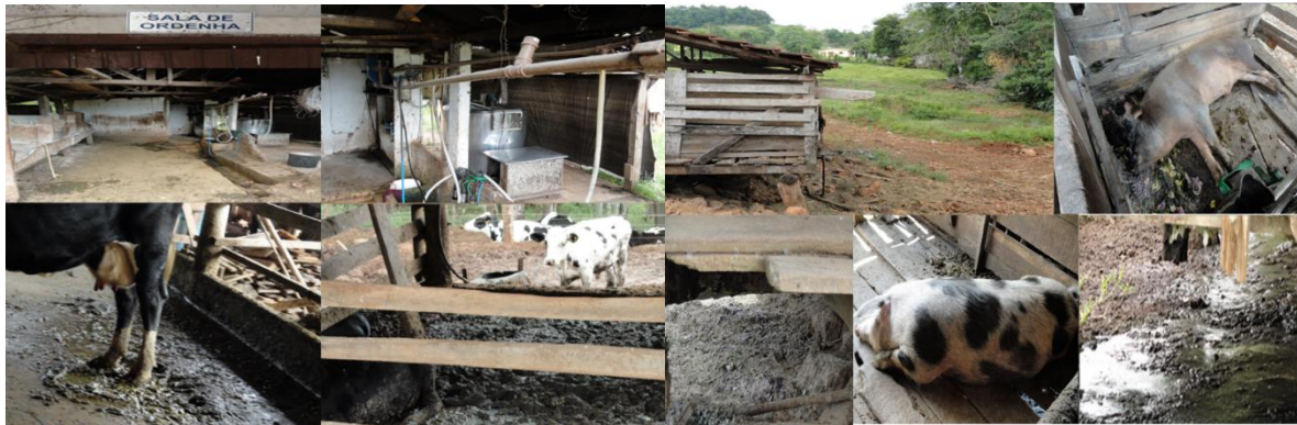
Figura 04 - Rejeitos dos animais de criação da bovinocultura e suinocultura com potencial poluidor dos compartimentos ambientais.

Nas propriedades rurais visitadas, os dejetos da bovinocultura (leite e carne) e da suinocultura, de modo geral, não recebem cuidados especiais. Este material, de elevado teor orgânico e de potencial poluidor, eutrofizador é acumulado nas baias, nas salas de alimentação e pocilgas e, geralmente, é escoado ou espalhado diretamente no solo sem os devidos tratamentos. Em alguns casos mais específicos, estes resíduos são direcionados para açudes de criação de peixes, o que, na maioria dos casos, promoveu a mortandade de animais (peixes), conforme relatado pelos proprietários. Para ilustrar essa realidade são apresentadas algumas imagens sobre o destino dos rejeitos animais, como demonstrado na figura 04.