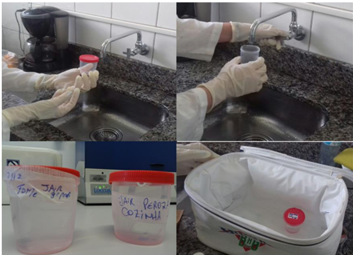
Figura 01- Imagem das coletas de água nas propriedades e posterior preparação para análise dos dados em laboratório.

Descrição da Técnica: Em laboratório, as amostras de água foram submetidas a análises de coliformes utilizando a metodologia baseada na Standard Methods for the examination of water and wastewater (CLESCERI, GREENBERG e EATON, 1998) e comparados à legislação brasileira vigente quanto aos critérios de potabilidade (Portaria 2.914/2011-MS). Utilizou-se o método rápido Colilert®/Laboratórios IDEXX que utiliza substrato definido ( Defined Substrate Technology/DST )