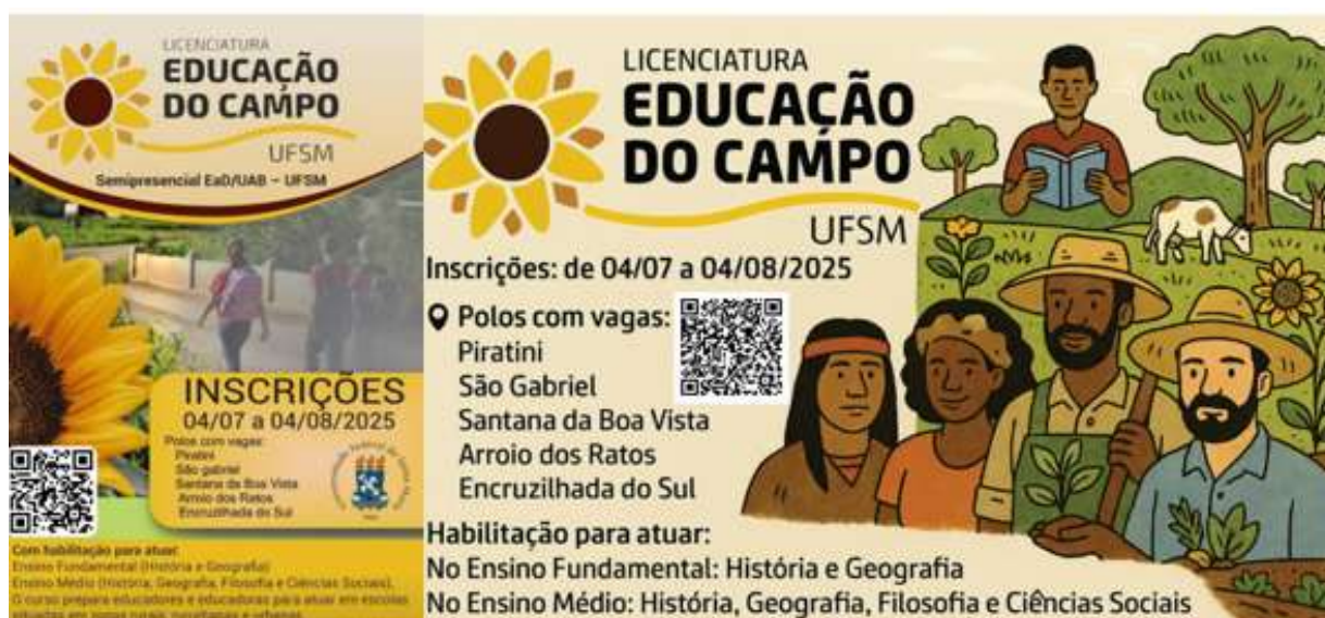
Figura 9 – Imagem “Card de divulgação” do Processo Seletivo EaD 2025

Com base nesse conjunto de análises e na autorização federal concedida pelo Edital CAPES/UAB nº 25/2023, a UFSM publicou o: Edital PROGRAD nº 057/2025 – Processo Seletivo EaD (Figura 9) , ofertando 150 vagas, distribuídas nos polos: Arroio dos Ratos, Encruzilhada do Sul, Piratini, São Gabriel e Santana da Boa Vista, constituindo a Turma 5 da Licenciatura em Educação do Campo.