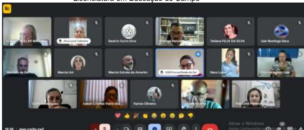
Figura 8 – Reunião online sobre trocas de Polos UAB para oferta do Curso de Licenciatura em Educação do Campo