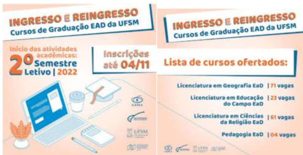
Figura 3 – Imagem “Card de divulgação” do Edital Ingresso e Reingresso 2022