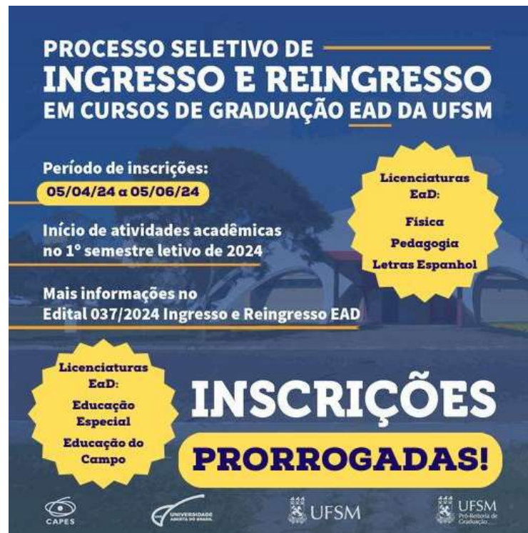
Figura 6– Imagem “Card de divulgação” Ingresso e Reingresso 2024

PROGRAD publicou o Edital PROGRAD nº 037/2024 – Ingresso, Reingresso e Transferência (Figura 6) . Também baseado em estudo institucional de vagas disponíveis, esse edital ofertou 47 vagas, distribuídas nos polos de Agudo, Canguçu, Santiago, São Gabriel e Três de Maio, atendendo perfis diversificados de candidatos e fortalecendo a política de permanência e mobilidade acadêmica da UFSM no âmbito da educação a distância.