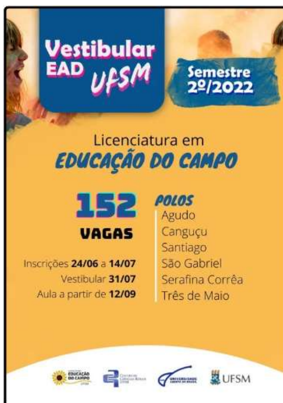
Figura 2 – Imagem “Card de divulgação” do Vestibular EaD 2022

Com base nesses dois diagnósticos — Pesquisa Institucional UFSM + Pesquisa FECOUAB — a UFSM aderiu ao Edital CAPES/UAB nº 09/2022 (anexo 1), resultando na publicação do: Edital PROGRAD nº 031/2022 – Vestibular EaD, que ofertou 152 vagas distribuídas nos polos: Agudo, Canguçu, Santiago, São Gabriel, Serafina Corrêa e Três de Maio, constituindo a Turma 3 do curso – Figura 2.