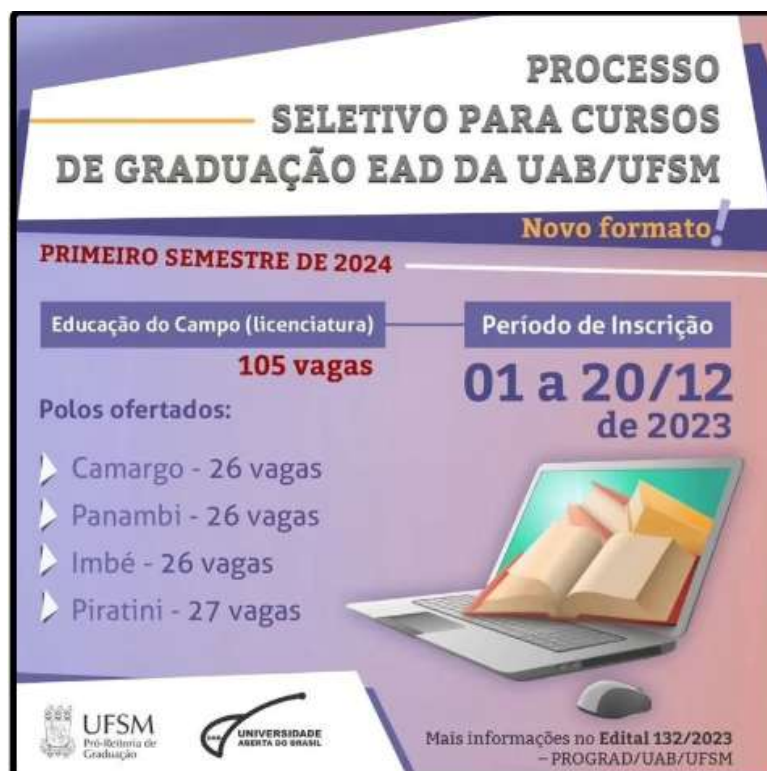
Figura 4 – Imagem “Card de divulgação” do Processo Seletivo EaD 2023/2024