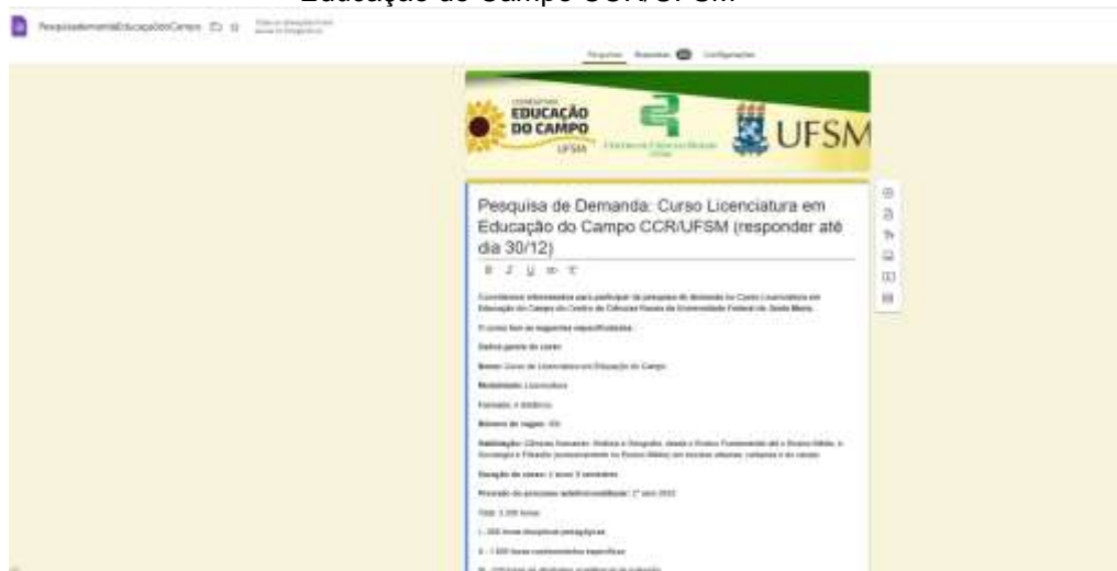
Figura 7 – Pesquisa de Demanda para o Processo Seletivo 2025 – Curso de Licenciatura em Educação do Campo CCR/UFSM

destinada a mapear: (1) necessidades atuais das redes municipais de educação; (2) demandas de movimentos sociais e comunidades do campo; (3) potencial de atendimento dos polos UAB; (4) territórios rurais com déficit formativo.