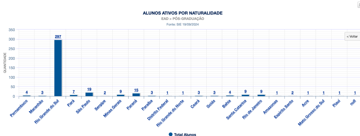
Figura 1: Alunos ativos por naturalidade no Ensino a Distância da UFSM.

Quanto à naturalidade, o estado do Rio Grande do Sul (297) conta com a maior quantidade de alunos naturalizados, seguido de São Paulo (19) e Paraná (15).