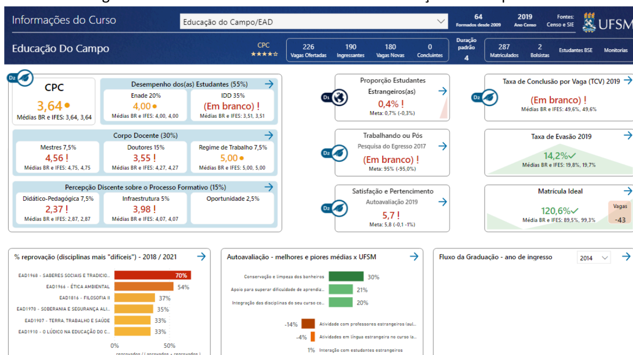
Figura 1 - Portal de Indicadores do Curso de Educação do Campo EaD