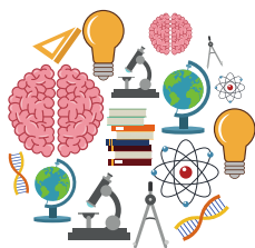
DIAGRAMAS, FOTOS, PRINTSCREEN...)