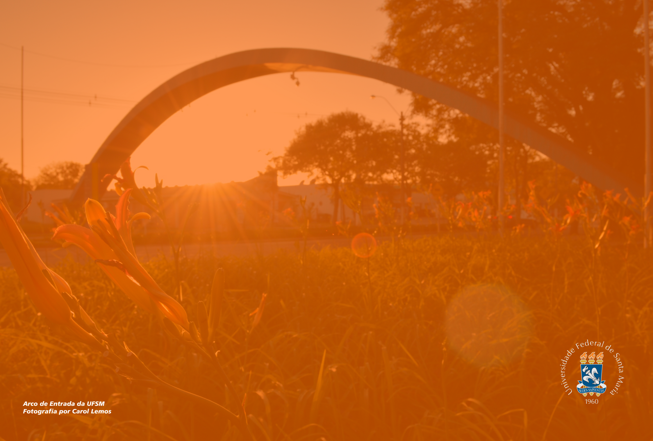
Arco de Entrada da UFSM