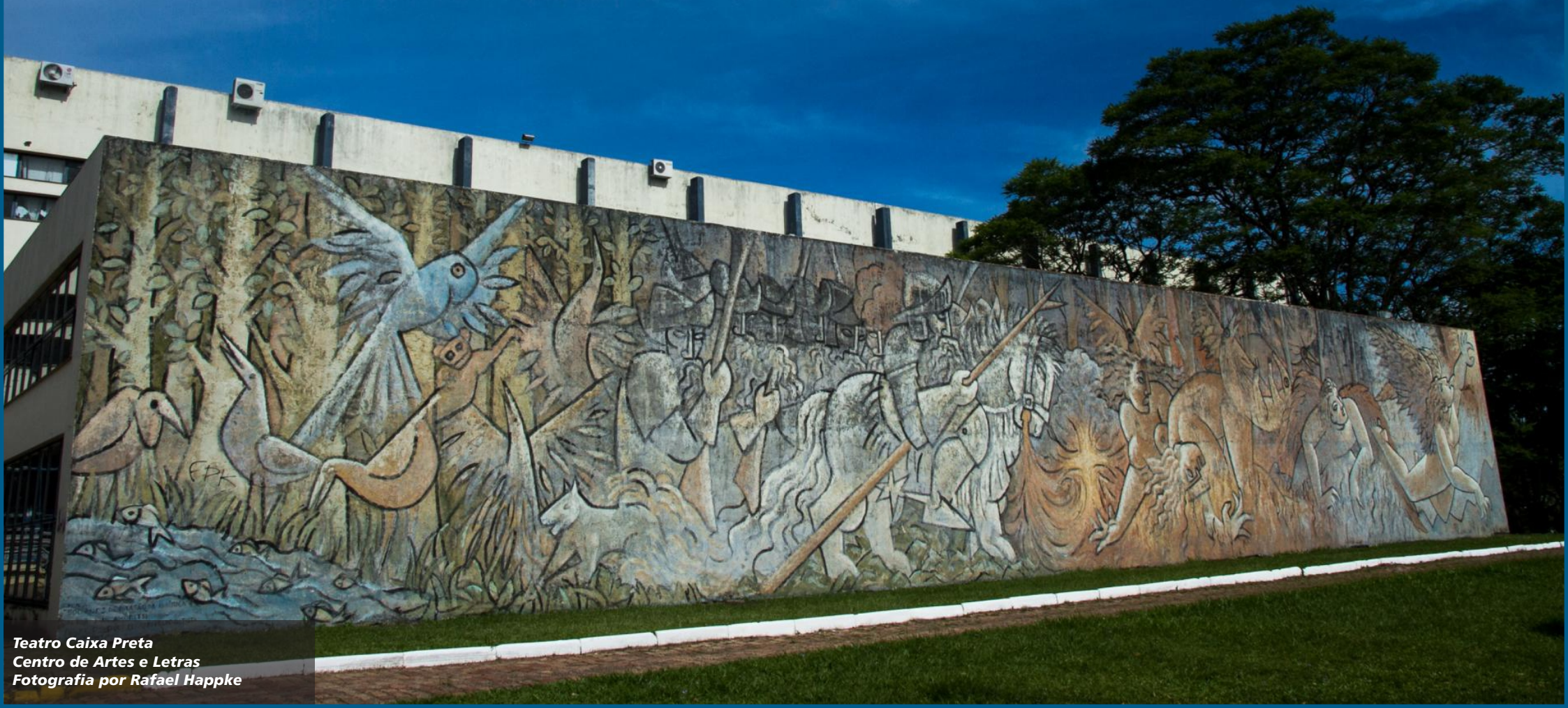
Teatro Caixa Preta Centro de Artes e Letras