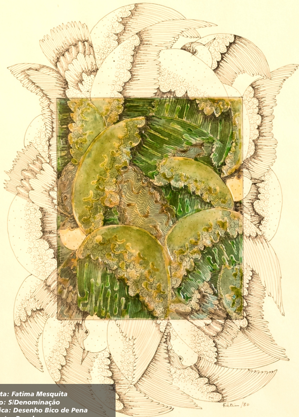
Artista: Fatima Mesquita Título: S/Denominação Técnica: Desenho Bico de Pena Suporte: Papel Ano: 1980 Dimensões: 50 cm x 63 cm