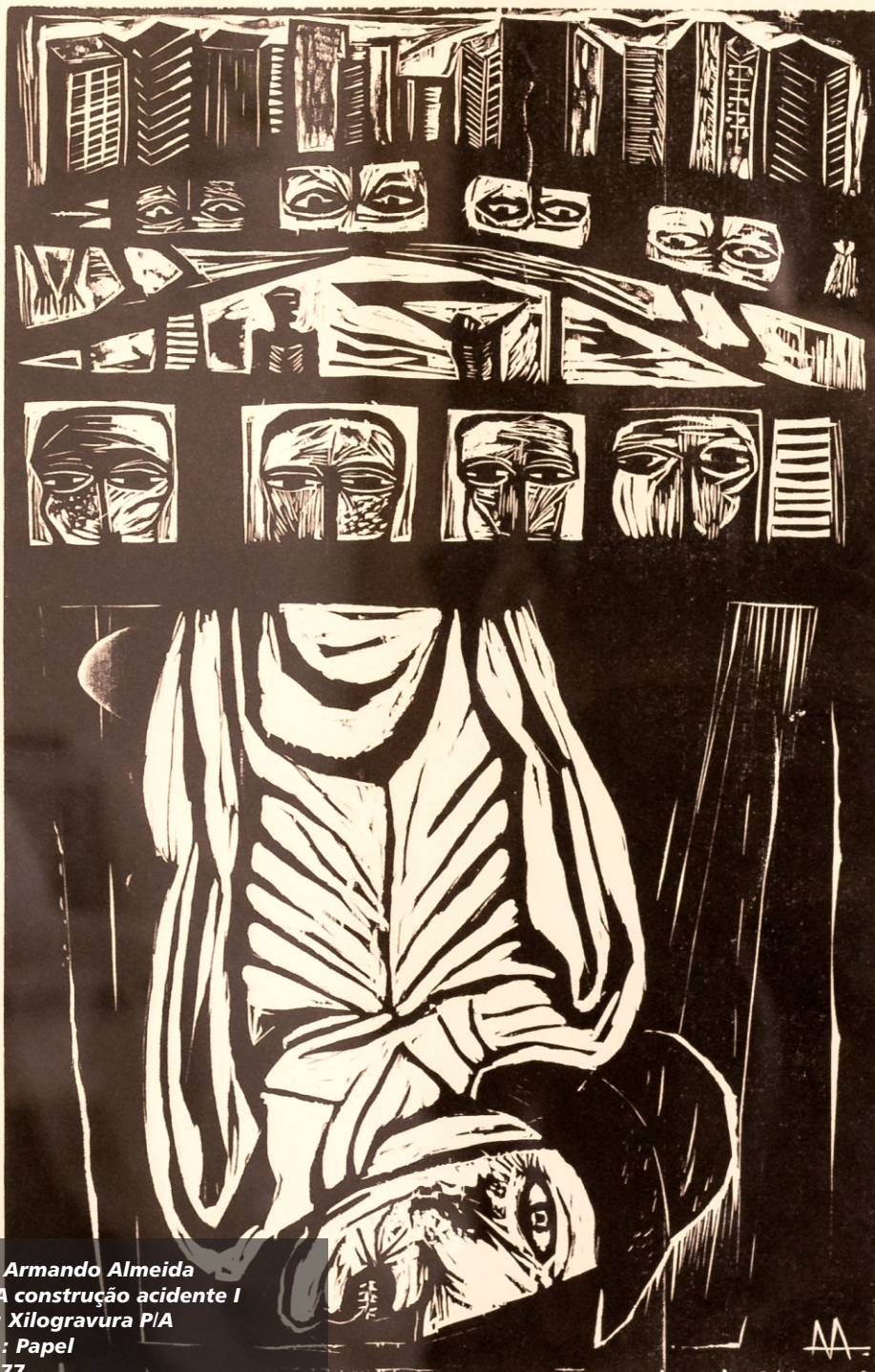
Artista: Armando Almeida Título: A construção acidente I Técnica: Xilogravura P/A Suporte: Papel Ano: 1977 Dimensões: 48,5 cm x 33,5 cm